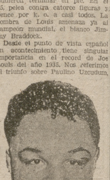
Joe Louis, campeón del mundo de boxeo.