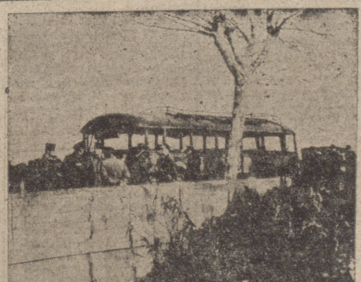
Este autobús estropeado por gendarmes franceses es el que hacia la línea Argel-Cherchell, el cual, en la región de Zerada, fué atacado por un grupo de rebeldes argelinos, que causaron siete muertos entre sus ocupantes.

Señalamos también las cifras conseguidas en la producción del carburo de calcio sobre 1955 en un 18,5 por ciento; superfosfatos, en un 8,5; paja, en un 16,5, y de forma semejante en celulosa, papel, neumáticos y refinado de petróleo. La simple lectura de cifras, que se reflejan en la vida ordinaria, como bien podemos testificar cada uno de nosotros, indican a las claras la potencia que viene desarrollándose a paso firme en la industrialización de nuestra Patria. Lo logrado hasta aquí es un signo de esperanza para un glorioso porvenir.