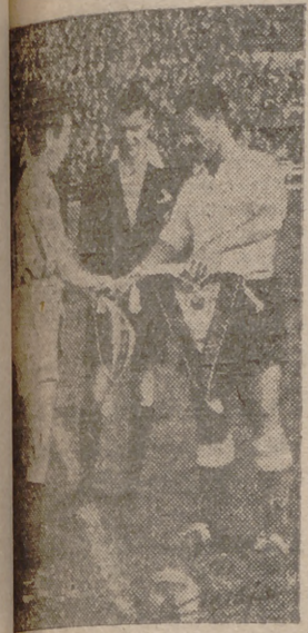
Grupo de banderines, recuerdo de esta visita histórica. El Valladolid y el Santander se encuentran por primera vez en el grupo de honor.

El resto del encuentro fué de pobre calidad AL LIDER PUEDE EXIGIRSELE MUCHO MAS