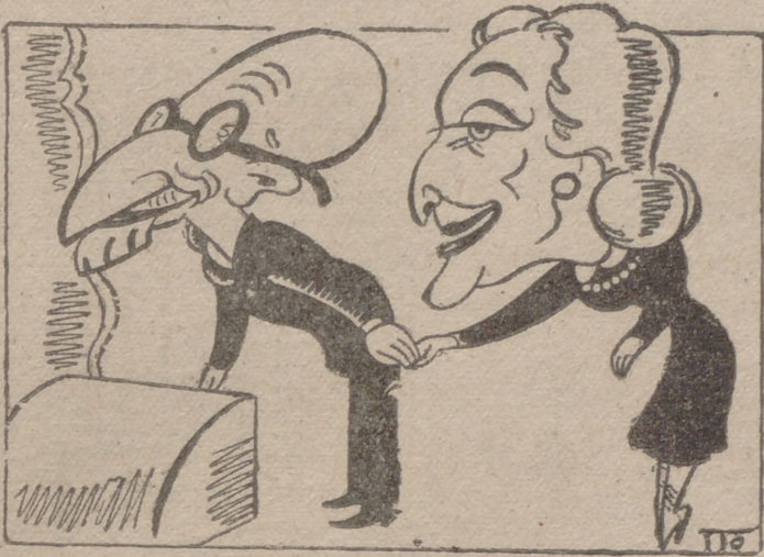
El ilustre don Jacinto Benavente y la actriz Irene López Heredia, recibiendo los aplausos del público. (Caricaturas por ITO.)

“Los autores actuales se malogran por los elogios” “HAY QUIEN CREE QUE EL DINAMISMO EN EL CINE CONSISTE EN SUBIR Y BAJAR ESCALERAS” “En la adaptación cinematográfica de mis obras no me han pagado más que los desperfectos”