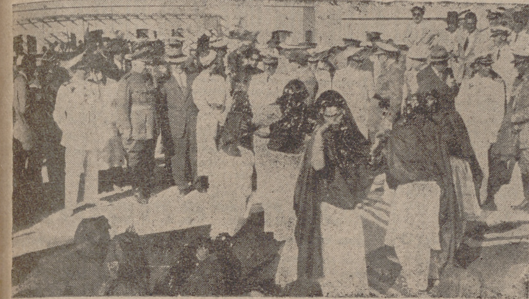
El Alun.—El jefe del Estado con su esposa y las personalidades que le acompañan presenciando las danzas de los grupos nómadas.—(Foto Cifra.)

Nueva Delhi, 23.—Las próximas conversaciones entre representantes del Tibet y el Gobierno comunista chino se celebrarán en Peiping, capital de la China roja. La delegación tibetana saldrá el 26 de este mes en avión para Calcuta, de paso para Peiping. Desde hace unas semanas se venían celebrando conversaciones en Nueva Delhi entre los mismos representantes y el embajador chino en la India, general Yuan Chung Hsien.—Efe.