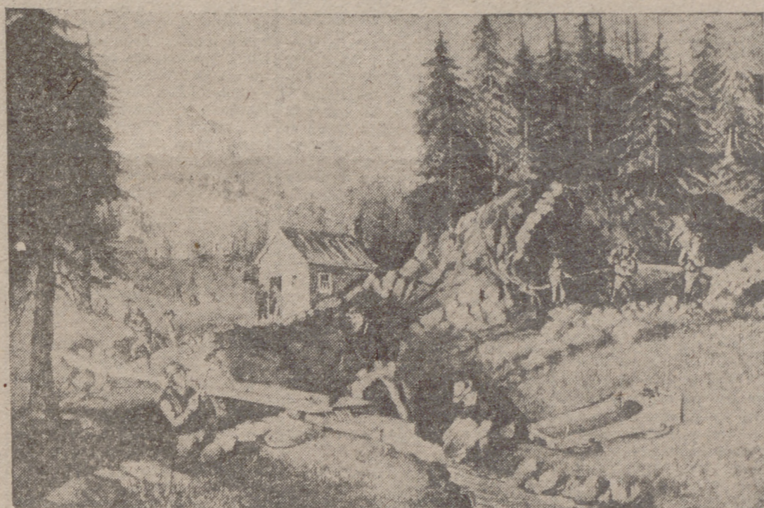
LA "FIEBRE DEL-ORO" EN CALIFORNIA. — En 1849, al año de haberse descubierto el precioso metal en el valle de Sacramento, más de 80.000 buscadores de fortuna habían convertido la apacible comunidad rural en una región de febril actividad.

JUAN AUGUSTO SUTER, EL HOMBRE DUENO DEL SUELO SOBRE EL QUE SE LEVANTA SAN FRANCISCO