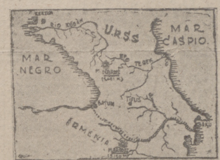
El croquis muestra la situación del Monte Ararat, al sur de la frontera de la U. R. S. S. El pequeño círculo marcado sobre el río Kubán señala el más probable emplazamiento del Paraíso Terrenal

El doctor SIKES continuará sus exploraciones en el Monte Ararat