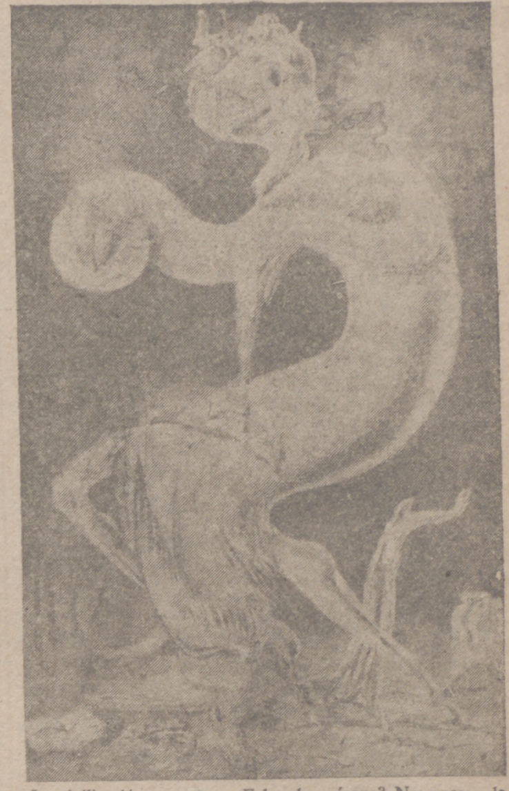
La civilización se muere. ¿Falta de oxígeno? No; exceso de hidrógeno.