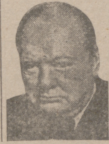
(Información en pág. 3.º)