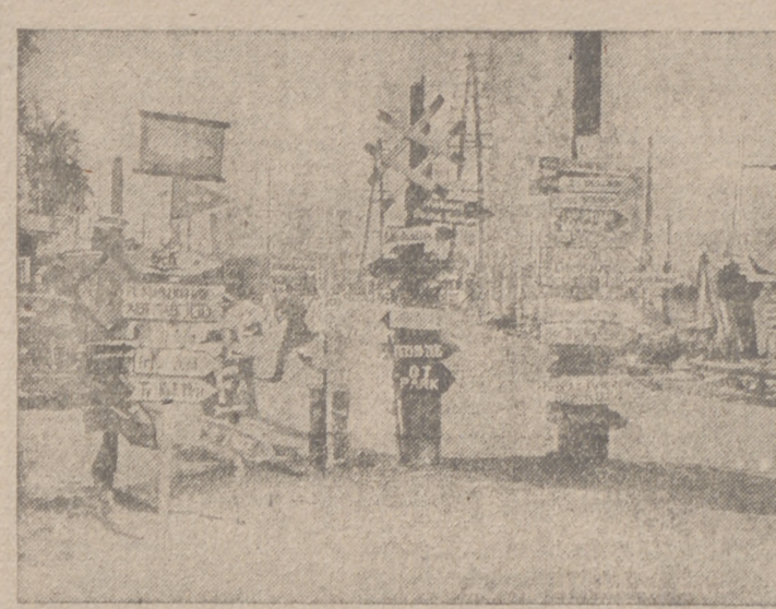
Este peregrífico de indicadores de direcciones nos habla de la complejidad del frente ruso

Londres, 10.—El exembajador soviético en los Estados Unidos, Uranski, pasará a ocupar un puesto de importancia en el Comisariado de Asuntos Exteriores de la Unión Soviética, según informa la radio de Moscú.—Efe.