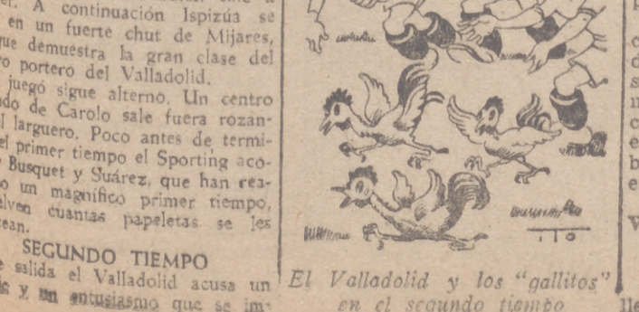
El Valladolid y los "gallitos" en el segundo tiempo