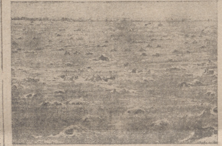
No se trata aquí de guardias de tropas, sino de soldados alemanes durmiendo en el campo cubiertos con paja contra el frío

A propósito de China manifestó: "Por último, sería un grandísimo desastre para civilización mundial y la resistencia del pueblo chino, contra una invasión no diese por resultado final la liberación de ese país. Este sentimiento reposa en el fondo de todos nuestros corazones."—Efe.