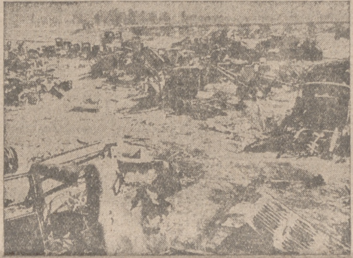
La retirada rusa equivale al caos y cementerio

En los combates sostenidos por nuestros cazas nocturnos, el teniente Lent ha conseguido su vigésima victoria.—Efe.