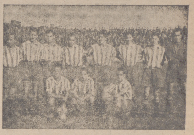
El equipo del Real Gijón, que el domingo empató a un tanto con el Valladolid Deportivo