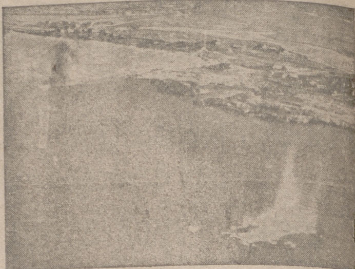
Bombas alemanas persiguen a los buques soviéticos en el Mar Negro