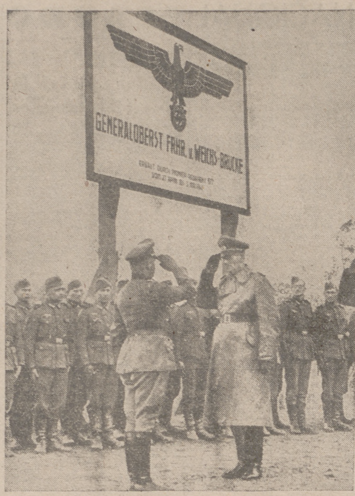
La inauguración del nuevo puente "Generaloberst Freiherr von Weichs" en Belgrado, recién reconstruido por los zapadores alemanes.

Pues bien—agrega—, esta idea que nos obsesó hasta el punto de llevarnos a una guerra, nos arrastra ahora a otra. Sin embargo, la libertad de los mares no es más que un fantasma, porque hoy, como siempre, se traduce en eso: dominio de Inglaterra. La ley de neutralidad necesita una revisión, pero si ésta ha de consistir en forzar el bloqueo con barcos norteamericanos, mejor sería pedir al Congreso, pura y simplemente, una franca declaración de guerra".—Efe.