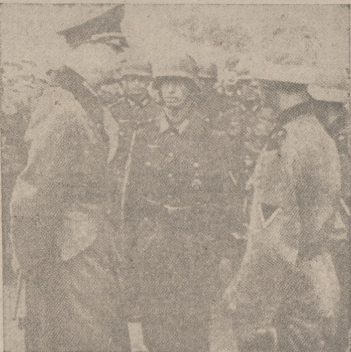
Un mariscal alemán conversando con paracaidistas que han combatido en Creta

Con respecto a las Sedes vacantes, en España se proveerán, conforme al acuerdo firmado esta mañana, por el Ministerio de Asuntos Exteriores y el Nuncio de Su Santidad, y son las siguientes Diócesis sufragáneas: Almería, Barbastro, Barcelona, Cádiz, Ceuta, Ciudad Real, Cuenca, Guadix, Ibiza, Jaén, Lérida, Orense, Palencia, Segorbe, Sigüenza, Teruel, Tuy, Urgel, Vitoria y Zamora. También está vacante la Silla Primada de las Españas y el Arzobispado de Toledo. El Obispado de Ciudad Real lleva consigo el Priorato de las Ordenes Militares, y el Obispo de Seo de Urgel es Príncipe soberano de Andorra. Los Obispos de Almería, Barbastro, Barcelona, Ciudad Real, Cuenca, Guadix, Ibiza, Jaén, Sigüenza y Teruel murieron, por Dios y por España, asesinados por la horda roja.—Cifra.