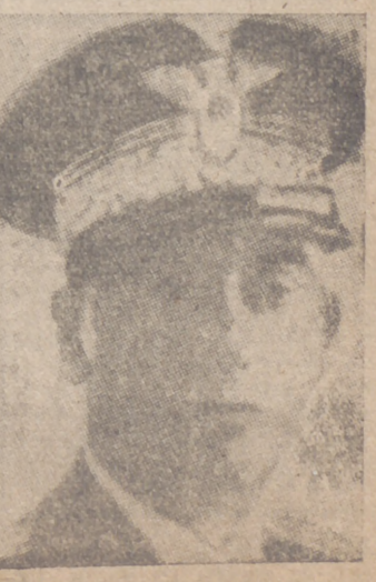
El nuevo subsecretario italiano de Guerra, general Antonio Squero

Poco después de su llegada se reunió bajo su presidencia el Consejo de ministros de Croacia. Los diarios croatas publican hoy ediciones extraordinarias en las que se da cuenta de la delimitación de fronteras entre Croacia y Serbia, de acuerdo con las aspiraciones croatas. Esta noche será publicado el decreto-ley en que se fijan las nuevas fronteras.—Efe.