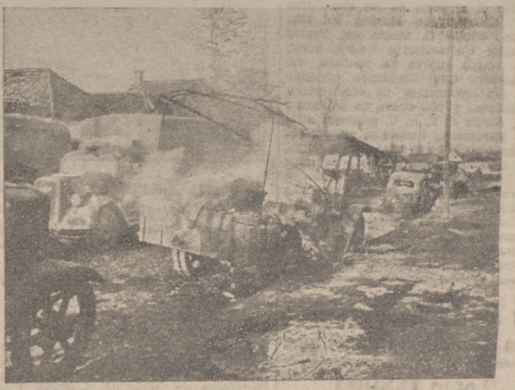
Una fotografía del "Dunquerque de los Balcanes". Un cuadro que siempre se vuelve a repetir al avance de las tropas alemanas

La Dirección General de Primera Enseñanza publicará los cuestionarios de los ejercicios, y terminado el plazo de presentación de instancias designará los Tribunales. Los ejercicios escritos tendrán dos horas de duración y los orales y prácticos una hora y media, respectivamente. La distribución de las 5.000 plazas anunciadas se hará proporcionalmente al número de opositores que hayan actuado en cada provincia en el primer ejercicio, y dentro de esto se hará lo que corresponda, de acuerdo con lo dispuesto en la ley de 25 de agosto de 1939.—Cifra.