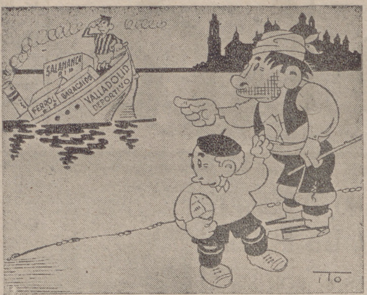
En Zaragoza y en el charco Por ITO —Oiga: ¡Que se va a pique...! —Sí, mánolo, sí, ¡Pero "cargao" con mucha honra!

Acción Católica J. F. DE SAN ANDRES Hoy, miércoles, círculo de estudios, a las siete y media.