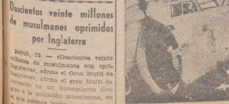
Un avión italiano, de modelo reciente

El "Yomiuri Shimbun" termina su información afirmando que "por medio de una colaboración con Chung-King se quiere distraer a las fuerzas niponas en China y garantizar al mismo tiempo las comunicaciones con Inglaterra."—Efe.