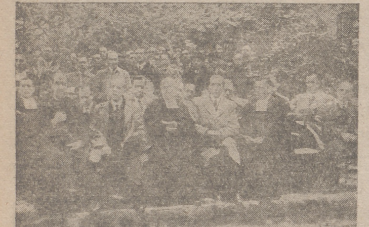
Personalidades que asistieron al acto.

El domingo se inauguró el monumento dedicado a los alumnos mártires de la guerra