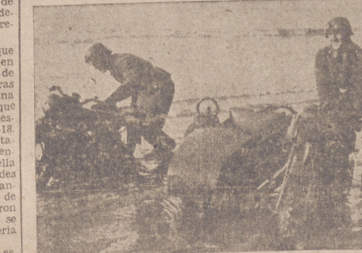
Una escuela de automovilismo alemana realiza sus prácticas en el terreno de la costa de Flandes

Por último, el sentido del mandato el encuadramiento—deben verificarse omitiendo la decisiva intervención de la jerarquía política. Conviene, además, asegurar el que siempre se conozca con certeza cual es o cual debe ser en cada momento el encuadramiento de todo militante.