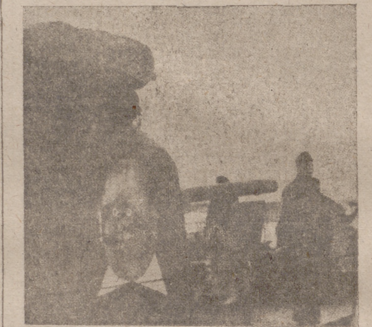
La caricatura de Churchill, dibujada como amuleto en la torreta del cañón de un torpedero alemán

La Exposición de Prensa alemana tiene también un confortable salón, que los organizadores han denominado "Rincón de lectura", donde los visitantes podrán disponer de gran número de periódicos y revistas.—Cifra.