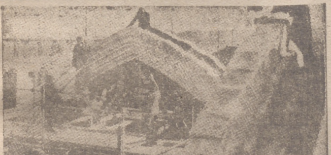
Para terminar la construcción de la nueva Catedral de Guildsford ha sido necesario recurrir a obreros retirados de edad venerable. Todo el personal anterior fué movilizad para servicios de guerra. Algunos de los artesanos actuales son ancianos de setenta a ochenta años, y todos han pasado ya de los sesenta

COLABORA A LA OBRA DE LA SECCION FEMENINA COMPRANDO EL SELLO «JOSE ANTONIO».