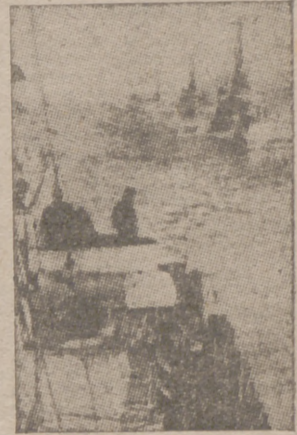
El dominio de los mares ya no pertenece a Inglaterra ni a las proximidades de sus propias costas. He aquí una formación de torpederos germanícos evolucionando en aguas británicas

Se refirió a la actitud del partido laborista, y recordó que en la última conferencia anual se decidió apoyar plenamente al Gobierno y esforzarse por la defensa de Inglaterra. No ha habido ningún cambio en el partido. Después de la guerra habrá un nuevo mundo diferente del antiguo. Tendremos que asegurar que este nuevo mundo sea próspero y dichoso.—Efe.