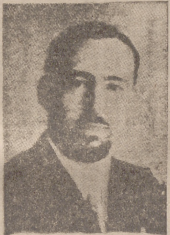
El capitán de corbeta Salvador Todaro, comandante de un submarino que, después de un combate muy duro, ha hundido en el Atlántico el barco armado inglés «Shakespeare», de 5.000 toneladas

New London (Connecticut), 1.—Ha sido botado al agua el nuevo submarino norteamericano «Gray Back». La botadura se realizó en el mayor secreto sin presencia de público.—Efe.