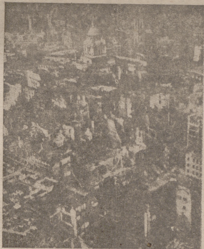
Esta es la primera vista panorámica de la City, después del último bombardeo devastador de la aviación alemana. Se diría que un gigante bolido se precipitó desde el cielo contra la faz del más célebre barrio de Londres, aplastándola. Es un gran claro abierto en la espesura del bosque urbano por una tormenta de fuego

No hace muchos días que Gamero del Castillo—buen tirador, dando en el blanco—hablaba de lo banal de una mística política viviendo eternamente en estado de esperanza. La mística creadora de la revolución ha reabsorbido ya casi todos sus propósitos tópicos indispensables. Narciso sabía esto. Por ello se resistía a conjugar indefinidamente un lenguaje que él había contribuido a imponer en medio de la liberal dialéctica española. Hablaba poco de José Antonio y menos de los gritos y estilo de la Falange. Hacía, simplemente. Oponía al verbo fácil el ejemplo de su conducta. Caridad bien entendida, respeto a todos; una honestidad total, intransigente; amor desmedido—o bien medido—por las cosas de España. Todo elogio resulta diminuto. A él tampoco le hubiera gustado. Era, ni más ni menos—en suma—que todo un hombre: caballeroso, primordialmente bueno. Un falangista cien por cien.