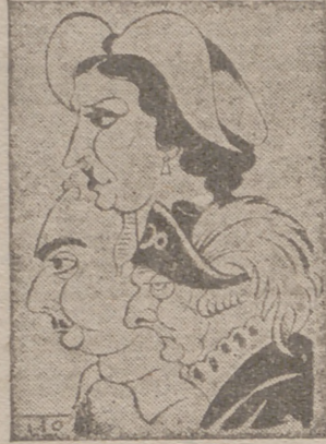
María Guerrero, Fernando Díaz de Mendoza y Ricardo Calvo

EN LOPE DE VEGA Estreno de «Por la Virgen Capitana», de José María Pemán. Poema dramático de una simple categoría poética es esta obra estrenada ayer en Valladolid, que