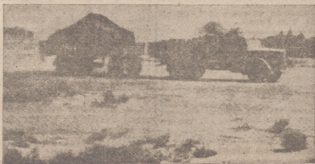
Transporte italiano camión de los frentes de Libia

San Francisco, 21.—En el proceso contra los dos marineros norteamericanos que arrancaron la bandera del Consulado General de Alemania, el juez, según informa la Associated Press, declaró de una manera especial: «Esto ha sido un insulto contra una nación con la que vivimos en paz, y yo, como funcionario, no puedo perdonar esta acción delictiva». El juez expresó su deseo de que Estados Unidos se mantengan al margen de la guerra, y estimó que el deber de todo norteamericano es apoyar estos esfuerzos.—Efe.