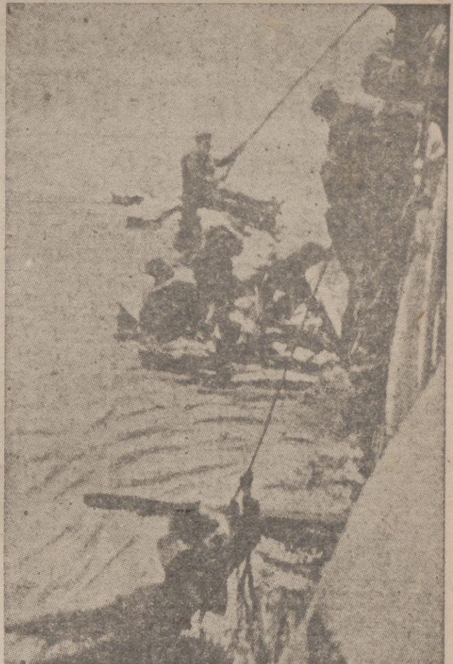
Salvamento en el Atlántico de los naufragos de un buque inglés torpedeado por un submarino alemán