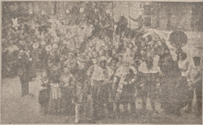
La Cabalgata de los Reyes Magos preparada para salir

Organizada por el Frente de Juventudes, visita el Ayuntamiento, Residencia Provincial y comedor de Auxilio Social