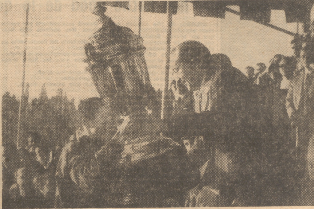
El excelentísimo señor ministro de Educación Nacional, don Jesús Rubio, hace entrega al capitán del equipo del Colegio de San José, de Valladolid, del trofeo conquistado en su calidad de ganadores absolutos de la competición escolar.

Campeón Nacional Escolar 1956: Colegio de San José (Valencia) (trofeo del ministro de Educación Nacional). Subcampeón nacional: Colegio de Nuestra Señora del Pilar (Madrid) (trofeo del ministro secretario general del Movimiento). 3.º, Colegio de la Inmaculada (Gijón) (trofeo del delegado nacional del Frente de Juventudes). 4.º, Colegio de Nuestra Señora del Pilar (Valencia) (trofeo del delegado nacional de Deportes). 5.º, Colegio de Huérfanos de Ferrovianos (Madrid) (trofeo del director general de Enseñanza Media). 6.º, Colegio de Nuestra Señora de la Bonanova (Barcelona) (trofeo del director general de Enseñanza Profesional y Técnica). 7.º, Colegio del Sagrado Corazón (Valencia) (trofeo del director general de Enseñanza Laboral). 8.º, Colegio de Champagnat (Salamanca) (trofeo del director general de Enseñanza Primaria). 9.º, San Miguel (San Sebastián); 10, La Salle (San Sebastián); 11, Ausias March (Barcelona); 12, Cervantes (Valencia); 13, Instituto (Almería); 14, Santa María (San Sebastián); 15, La Salle (Almería); 16, Jaime Balmes (Barcelona); 17, Sagrado Corazón (San Sebastián); 18, San Ignacio (San Sebastián); 19, El Salvador (Valladolid); 20, Luis Vives (Valencia); 21, San Ignacio (Barcelona); 22, Loyola (Oviedo).