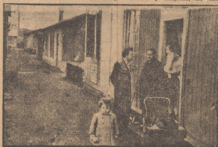
Los sacerdotes-obreros viven en el mismo medio que sus compañeros de fábrica. En estas casitas alineadas, construidas generalmente de madera, viven los trabajadores, y con ellos, el sacerdote, para llevar de manera más directa su labor a buen puerto

¿Se da cuenta el lector de lo que es el sacerdote-obrero? Roma, con su reconocimiento oficial, aunque aún sólo sea a título de experimento, le ha dado un nuevo impulso. Y a ese centenar de sacerdotes que trabajan en Francia, sin duda, se irán sumando otros muchos para ganar aquello que a Pío XI le hizo exclamar que estaba perdido.