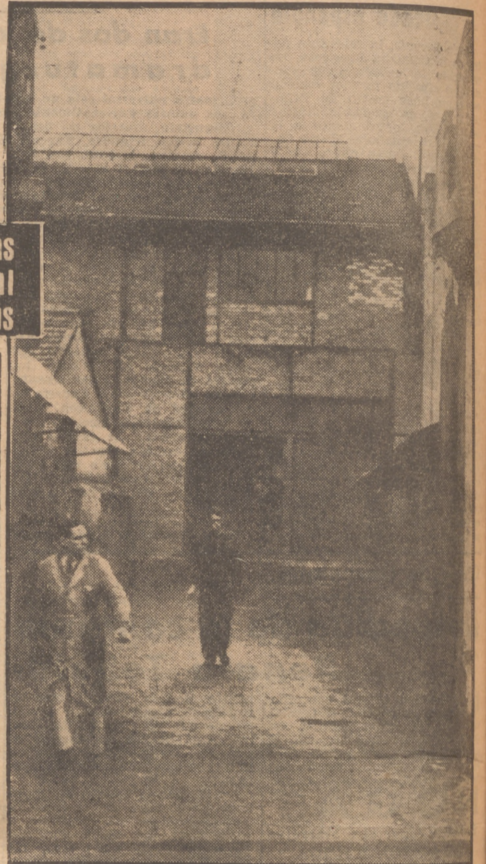
Otro sacerdote-obrero a su salida de la fábrica. Exteriormente no hay ninguna diferencia con sus compañeros. Viste «mono azul» y lleva la bolsa con la tartera de la comida, como los demás. A fin de semana cobrará su salario, que le permite llevar la misma vida que los demás obreros, dándose cuenta en sí mismo de las necesidades que tienen

Que en seguimiento de las industrias se había alejado de la capital y de las obligaciones religiosas