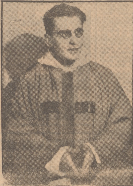
Uno de los sacerdotes-obreros que actúan en París, y que ya tuvo sus primeros contactos con el proletariado durante la guerra, en un campo de concentración de Polonia. El refiere: «Allí, en aquella masa de hombres privados de todo interés religioso, encontré yo campo para mi apostolado. Constatándose la necesidad de una vida enteramente realizada junto a los más pobres...»

La misión, que ya se apuntó buenos éxitos, actúa con la ayuda de militantes católicos