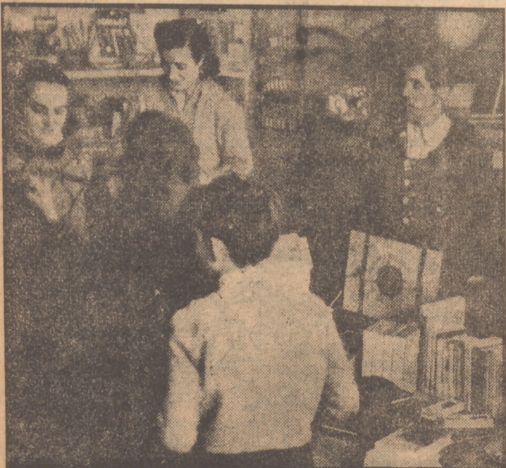
Esta es la base de operaciones de una familia constituida en militante del catolicismo, que tanta ayuda prestan a los sacerdotes-obreros. Una pequeña librería popular, adonde la gente acude en busca de distracción, es buen sitio para dar, además, consejo y establecer un medio de ayuda, cariño y solicitud

Habría que decir, primero, que el sacerdote-obrero es una necesidad de Francia. A principios del siglo pasado, el proletariado francés tuvo que seguir a las nuevas industrias que le daban el pan de cada día, y como éstas se trasladaron a la periferia de las ciudades, la Iglesia se quedó algo alejada de la vida de estos hombres. Cuando se quiso acudir era demasiado tarde. Las masas