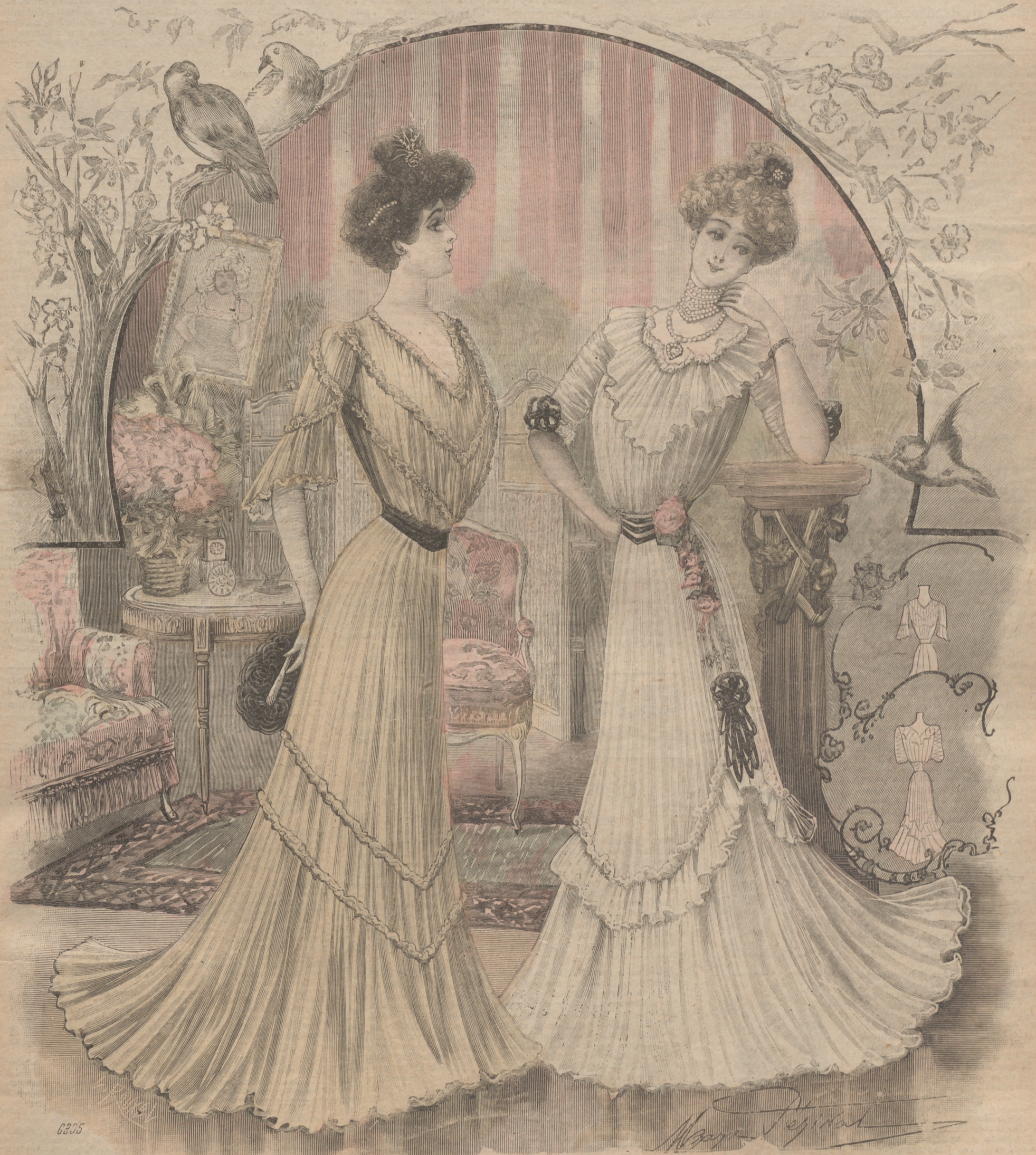
1. - Toilettes para señoras jóvenes y señoritas.

SUSCRIPCIÓN 6 Meses, 1 AÑO. En toda España. 4 pts. 7'50