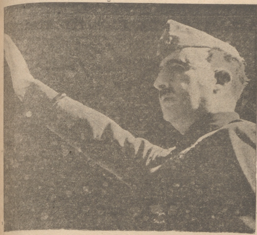
FALANGE no puede permanecer mudo, ante el grandioso acto celebrado ayer en Barcelona con motivo de la visita del Generalísimo.