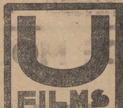
La marca de prestigio

Realizada en los Estudios U. F. A. de Berlín