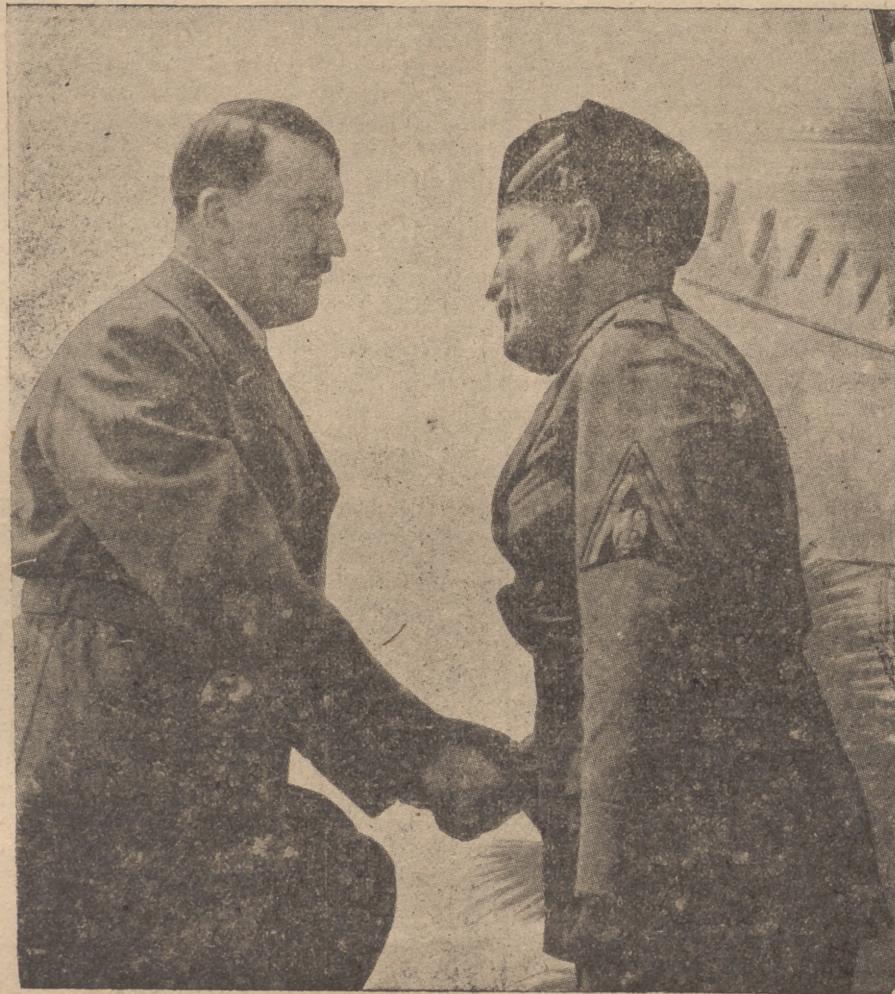
EL FUHRER Y EL DUCE

España en pie, en este tercer otoño triunfal. Bosques de manos abiertas de obreros y patronos formando arco triunfal. Gargantas roncadas de lanzar al aire azul el triple grito de: FRANCO, FRANCO, FRANCO!