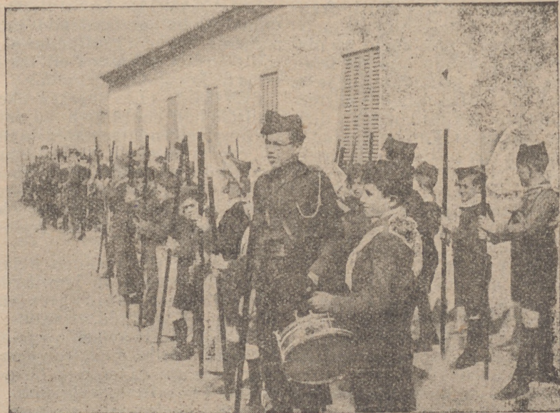
EL MOLINAR: La promesa más elocuente y sincera de nuestra Revolución: Los flechas entusiastas, son la viva esperanza de la España Imperial que se presente en estas horas trágicas, que vive nuestra Patria ¡FLECHAS!