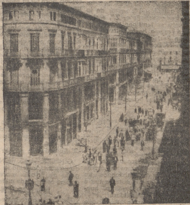
La calle de Larios, una de las principales arterias de la hermosa ciudad, aparece aquí con sus edificios saqueados y quemados.