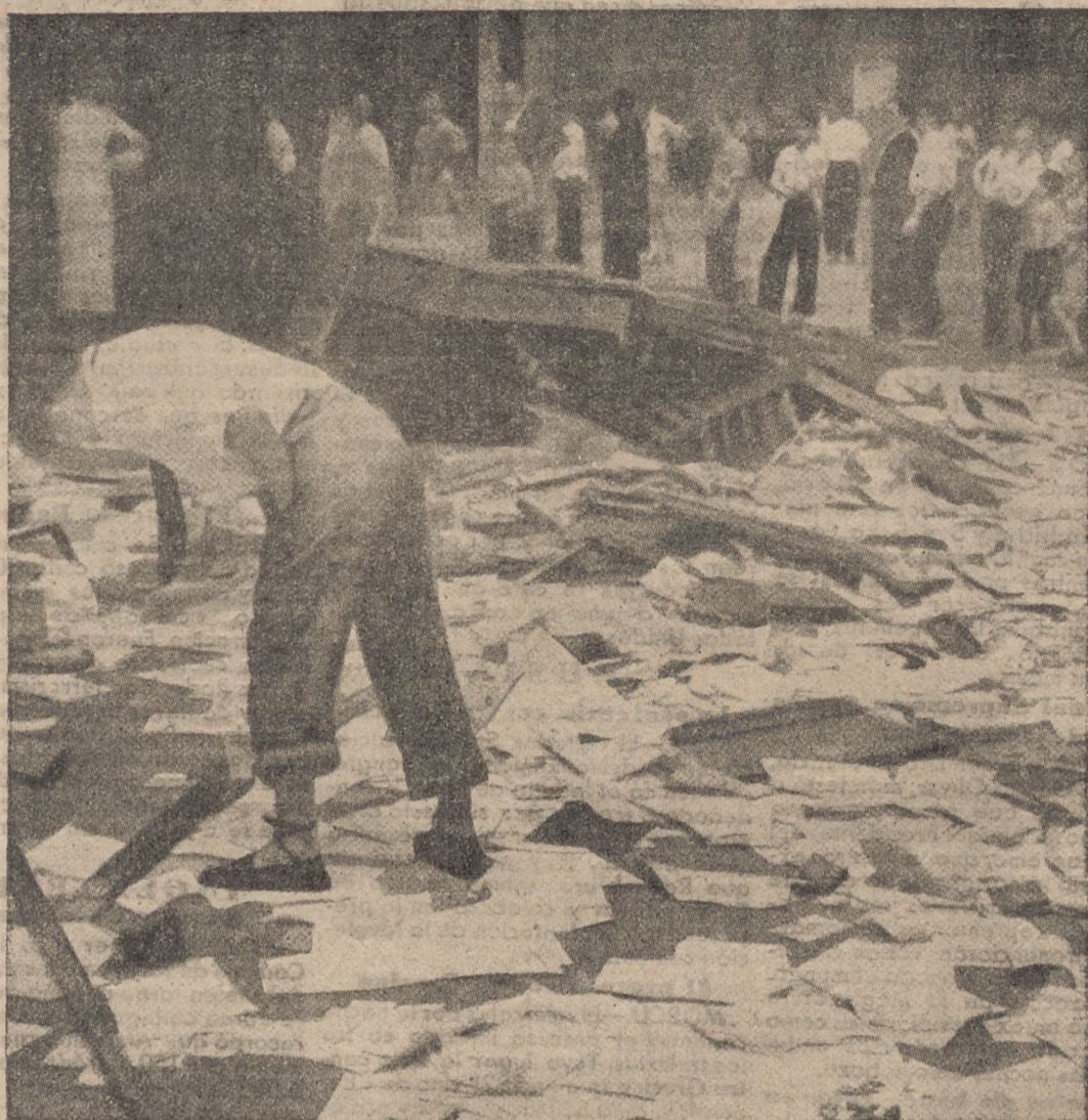
Los asaltos a todos los centros y casas que huelen a antimarxismo han sido y son frecuentísimos.

designado para el cargo de alto comisario de la Liga de Naciones en Danzig, informó al secretario general de la Liga que no puede aceptar.