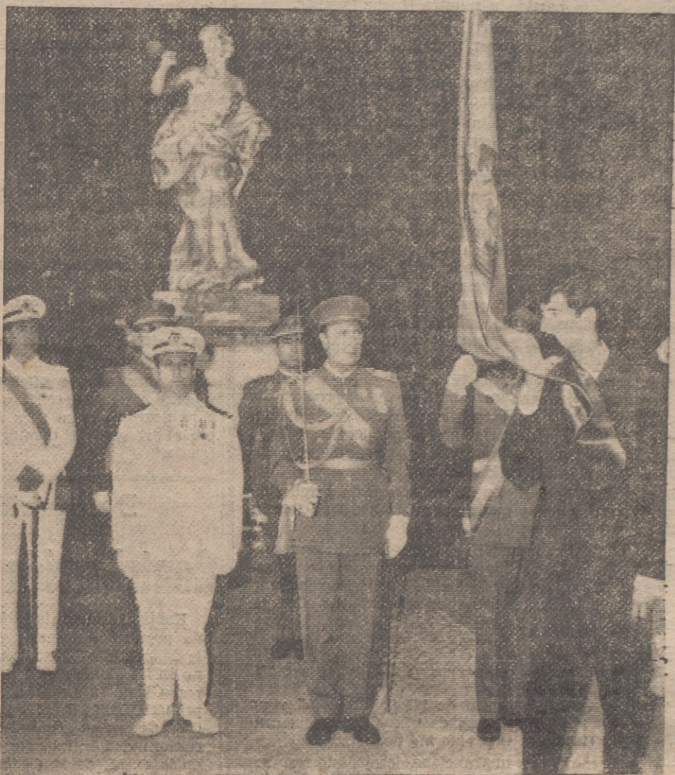
Con motivo de la fiesta nacional se celebró en la sede de la Embajada de España en Lisboa la solemne ceremonia de jura de la Bandera por los jóvenes españoles que residen en aquel país. Asistieron el embajador, señor Ibáñez Martín, y diversas autoridades militares y civiles. Vemos en la fotografía el momento en que uno de estos reclutas besa el pabellón nacional.