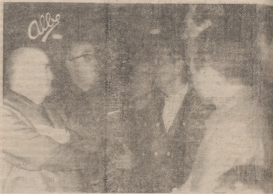
El señor Gómez Jiménez de Cisneros conversando con los vecinos de Cabretón.

hesión del pueblo cerverano y terminó deseando una grata estancia para todos en Cervera del Río Alhama. A estas palabras —subrayadas con el aplauso de los que asistieron— contestó el señor gobernador, diciendo que su deseo hubiera sido visitar Cervera mucho antes, pero que, por diversas circunstancias, el viaje se había ido aplazando hasta el día de