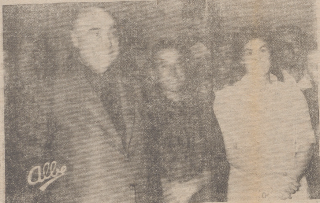
El gobernador civil con una señora, a la que acompaña su esposo, que escribió al Caudillo interesándose sobre un pantano y que recibió en consecuencia la visita de un técnico enviado por Su Excelencia.