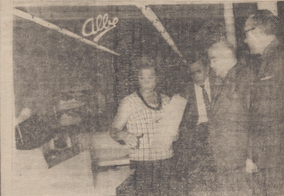
Visitando la fábrica de gabardinas.

CONDUCTOR: No sea temerario; puede estar seguro de sí mismo, pero no sabe lo que harán los demás. Conduzca con prudencia