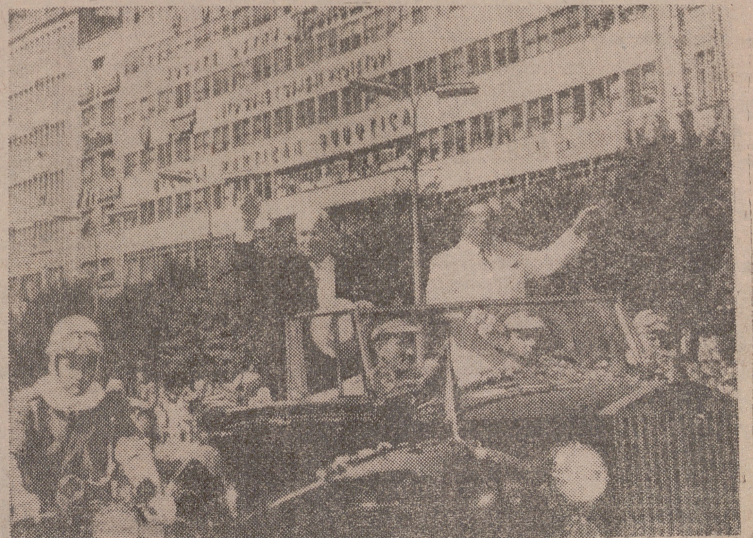
En coche descubierto, Nikita Kruschev y Tito atraviesan las calles de Belgrado saludando a la multitud. El líder soviético se encuentra pasando unas "vacaciones" en Yugoslavia con el hasta ahora "hijo descarriado" del comunismo internacional.