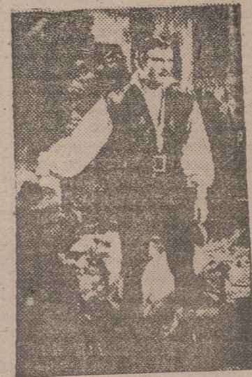
YUL BRINNER en "Los bucaneros"

Aunque corría a su cargo la supervisión del film, Cecil B. de Mille confió su realización a Anthony Quinn. Y éste se ha revelado tan buen realizador como buen actor era y es. La película, divertida, amable, viva de colores, con una acción