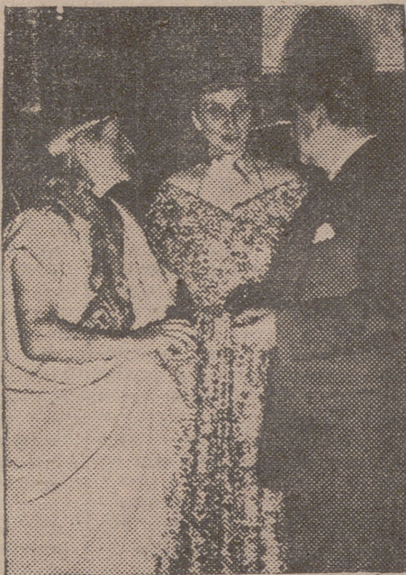
Este aquí una reciente fotografía de Raymond Duncan (a la izquierda) el "Inmortal" Sioux de Paris