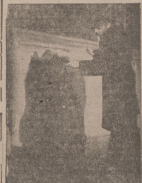
Swásticas antisemitas en una sinagoga de Nueva York

BERLIN, 8.—El canciller Adenauer ha enviado un telegrama a las organizaciones juveniles del Berlín Occidental en el que dice: "Me siento feliz de ver que la juventud berlinesa