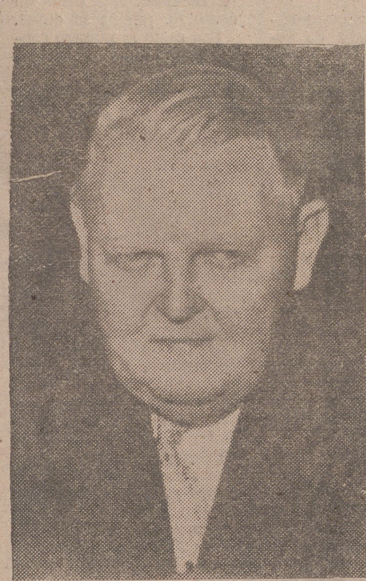
Ludwig Erhard, candidato a la Presidencia

Aunque la nota del presidente estadounidense le recibió el primero pocas horas después de su llegada a Londres, aún no se sabe cuándo irá a entrevistarse con Eisenhower.—(Efe).