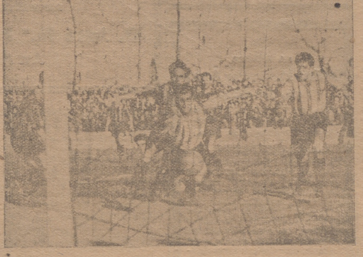
En el último minuto del primer tiempo, toda la vanguardia blanquiroja busca, en tromba, el empate. La pelota termina por colarse hasta la red.