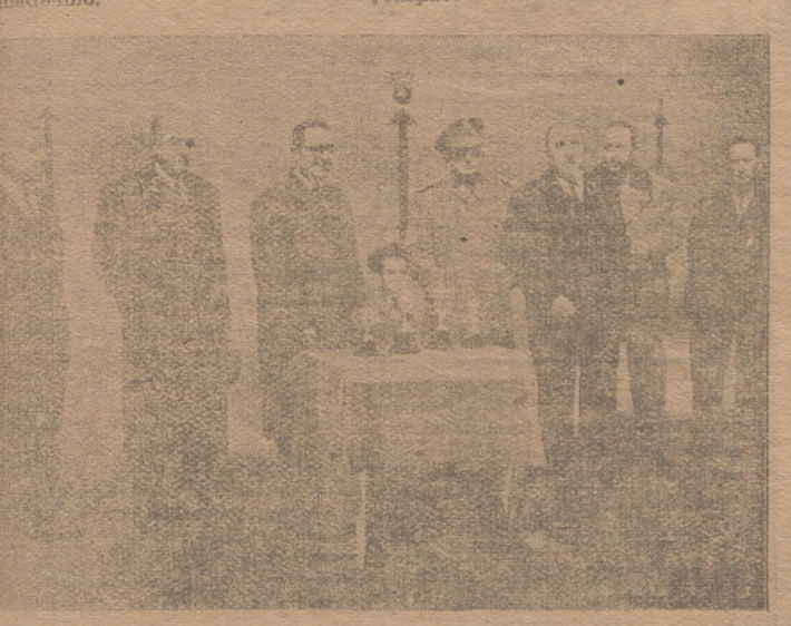
M. EXCMO. SR. GOBERNADOR CIVIL PRESIDENDO LA ENTREGA DE TROFEOS A LOS CAMPEONES PROVINCIALES DE PELOTA.