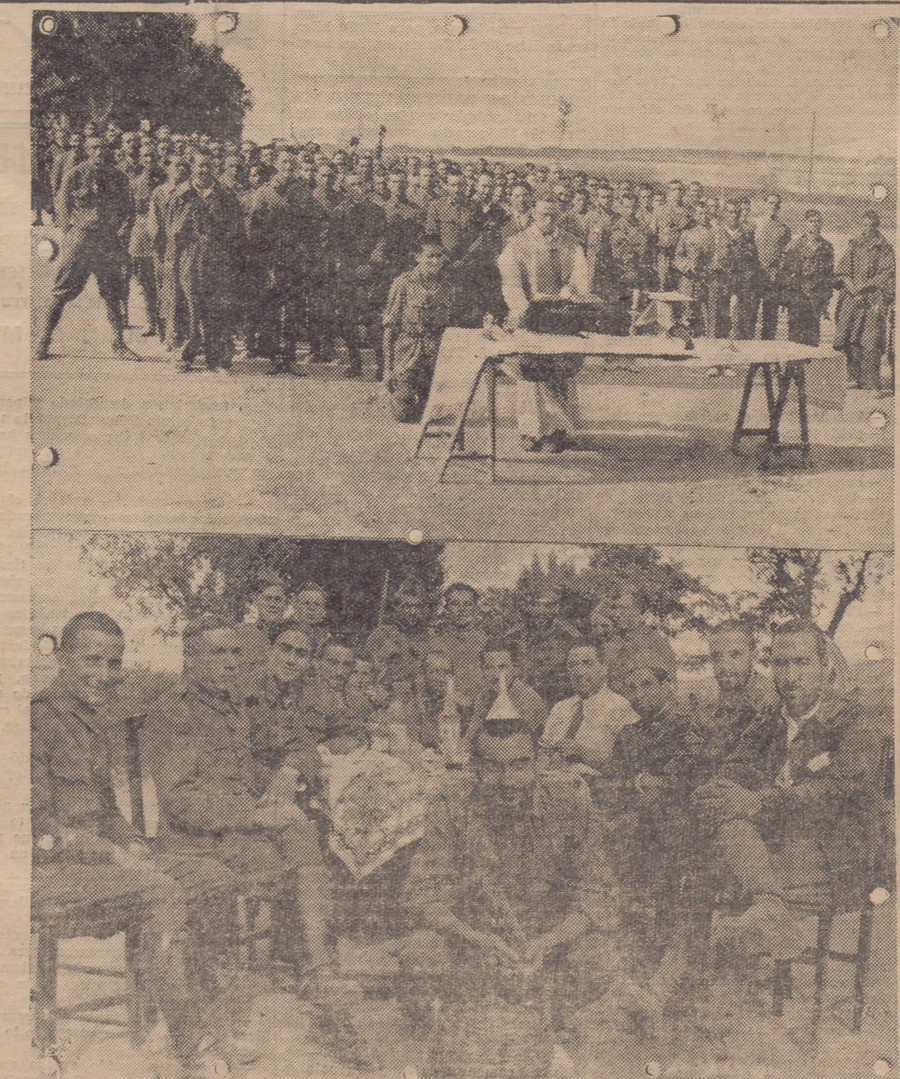
NUESTROS SOLDADOS EN ALMUDIEVAR. — ARRIBA: MISA DE CAMPAS A LA QUE ASISTEN SOLDADOS DE BAILEN Y FALANGISTAS DE LA PROVINCIA. — ABAJO: UN GRUPO DURANTE LA COMIDA