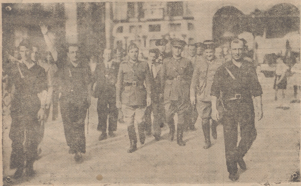
CALAHORRA.—EL SEÑOR GOBERNADOR CIVIL DE LA PROVINCIA, SEÑOR CAPITAN DE LA GUARDIA CIVIL, SEÑOR MIRANDA DE TAFALLA Y EL TENIENTE NAVARRO EN VISITA POR LA POBLACION

Para el pago de suscripciones recomendamos a nuestros abonados utilicen el Giro Postal, anotando con claridad sus nombres y enviándolos a la siguiente dirección: "Al Periódico LA RIOJA, Logroño".