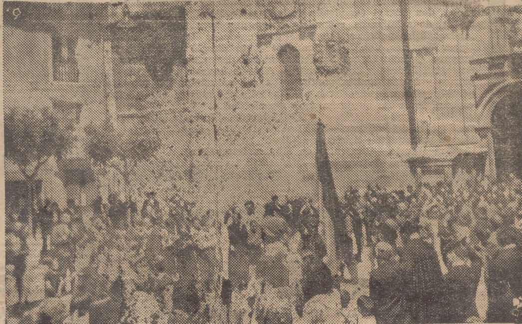
SANTO DOMINGO DE LA CALZADA.—EL REQUETE SALIENDO DE MISA EL DIA DE SANTIAGO