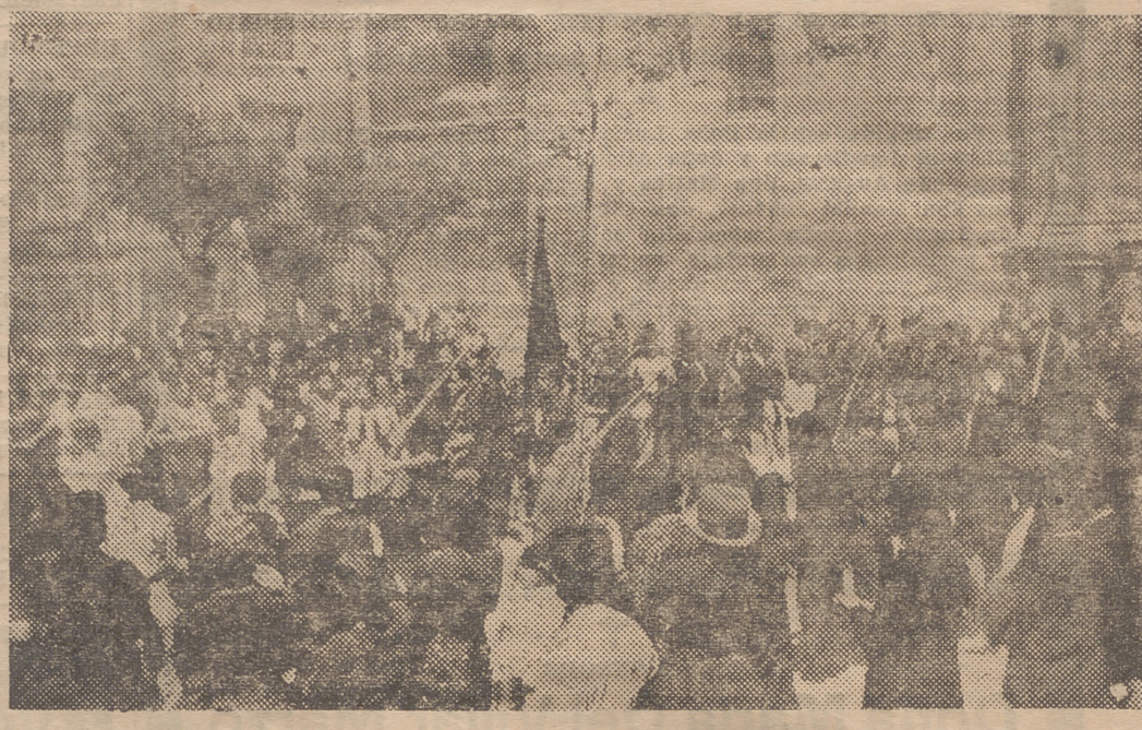
SANTO DOMINGO DE LA CALZADA.—MILICIAS FASCISTAS SALIENDO DE MISA EL DIA DE SANTIAGO