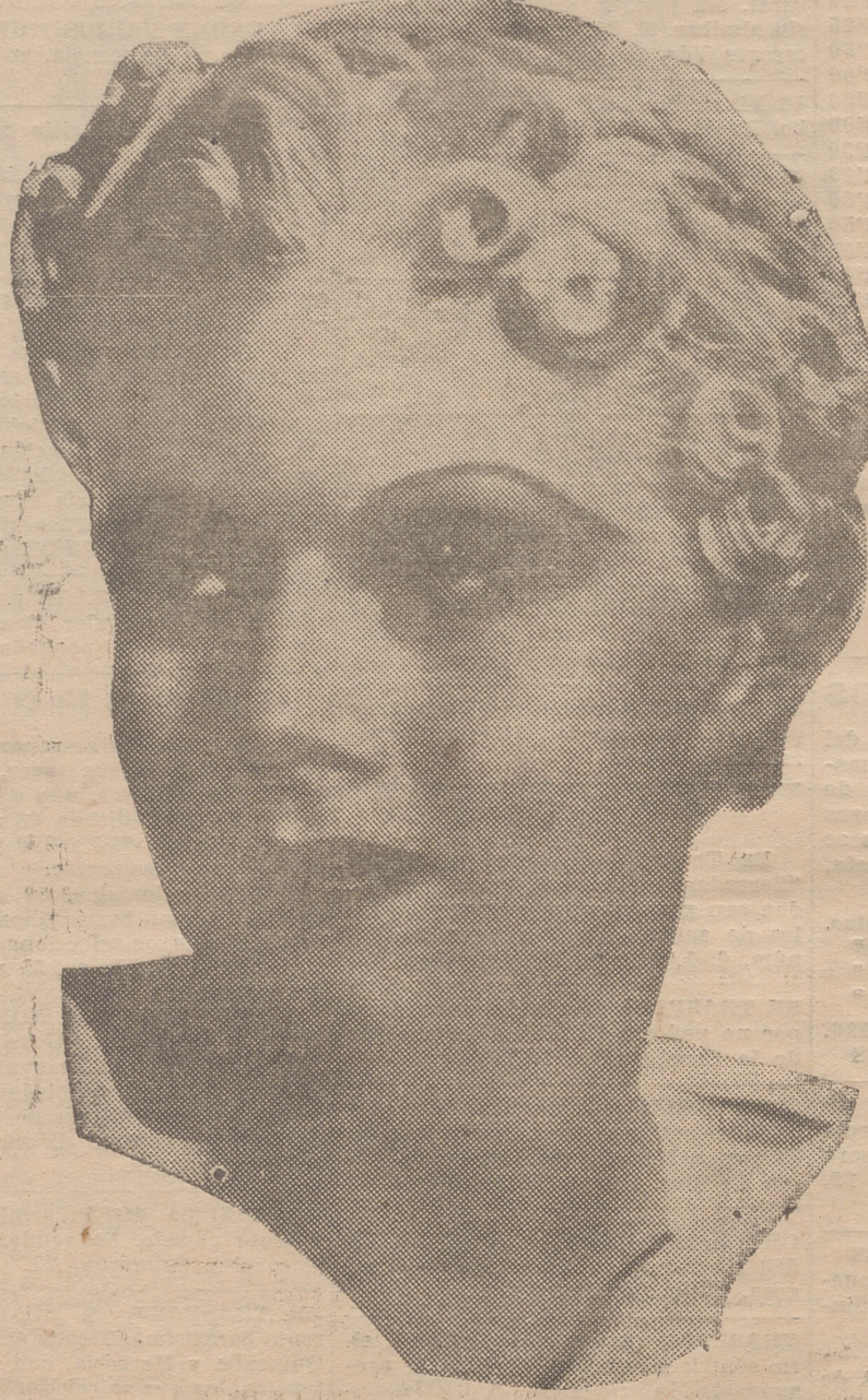
UNA FOTO DE LA ORIGINAL STAR JEAN HARLOW, EN LA QUE SE EXHIBE CON UN PEINADO MUY EXTRAÑO EN ELLA