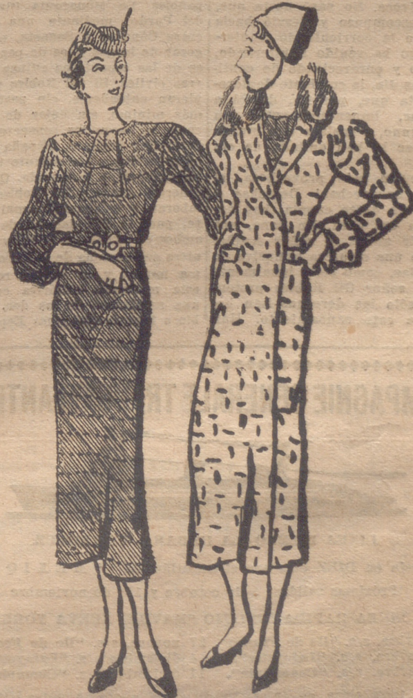
Traje de lana granate mosqueada de gris formando rayas horizontales. Cinturón del mismo tejido con hebilla metálica. — Abrigo en lana granateada de "beige" y marrón. Cuello de linco.

CRISTALERIAS, VAJILLAS, ARTICULOS PARA REGALO "SEVRES" Sagasta, 2. — Bajos Seminario.