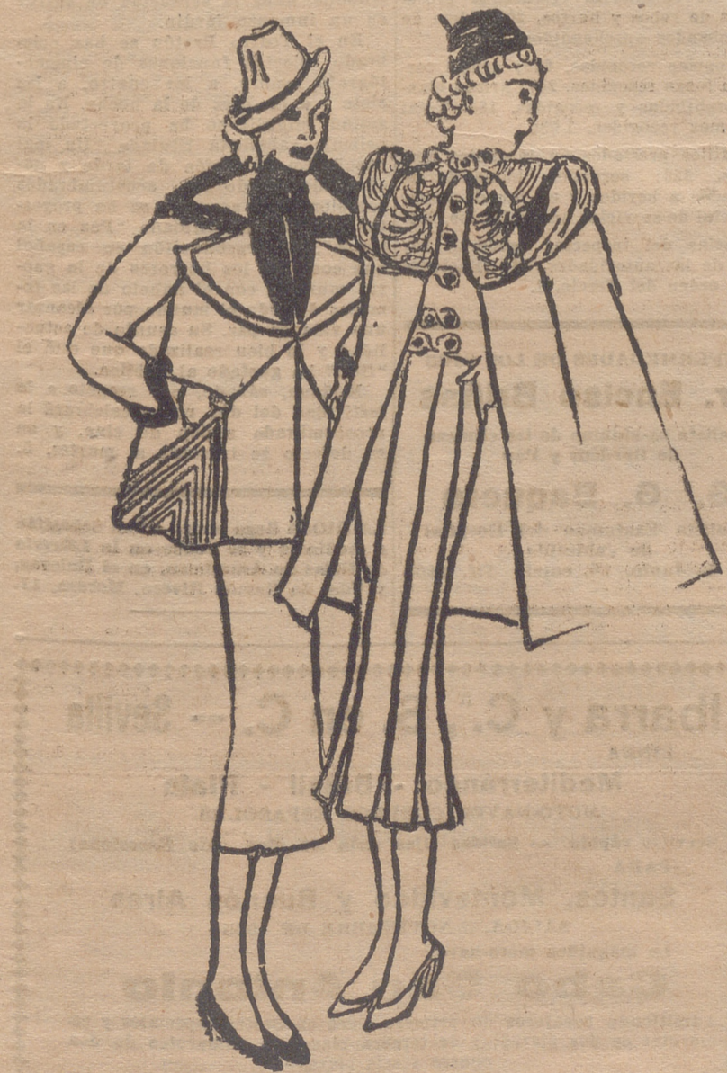
Chaqueta tres cuartos en "tweed" mezclado de verde o "beige" y rojo. Cuello de "ragondin". Falda de lana verde oscura. Chaleco de "ragondin" sujeto al cuello por una corbata. — Traje en lana "beige" claro. Chaleco de comadreja marrón, cerrado con botones de cuero y trenillas del mismo tono. Capa con cuello pelerina de la misma piel que el cuello

París, nuevamente, como antes de la guerra, esos tipos maravillosos de mujeres, eslavas, tan estilizados, y que tan bien concuerdan con el "chic parisien".