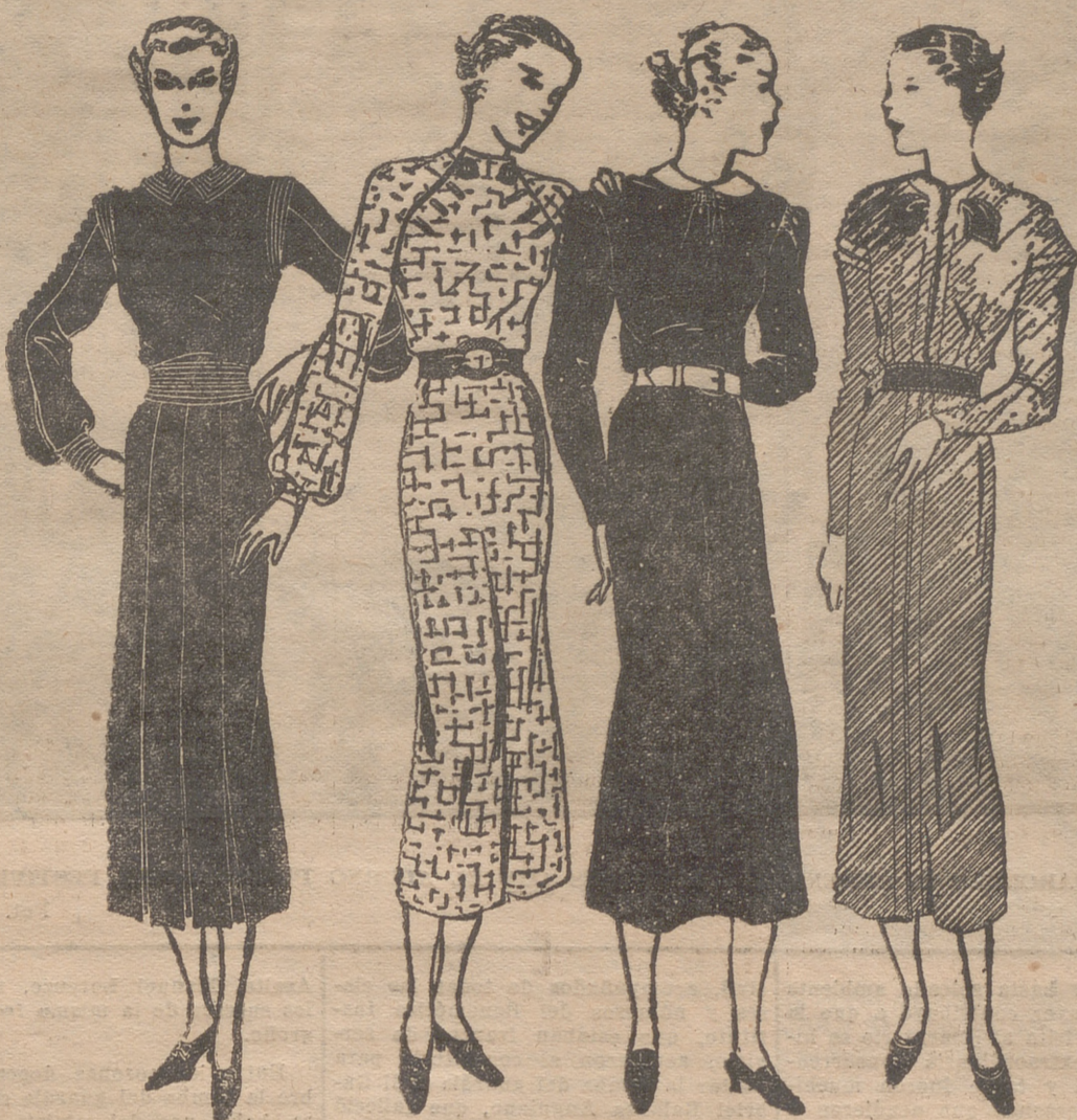
Traje en lana azul marino, cuyo adorno es espumante de tono gris pálido. — Traje de lana "grego" y herrumbre. Botones y cinturón de cuero color herrumbre. — Traje negro con puntos verdes. Cinturón verde. — Traje color ladrillo. Punto y cinturón de ante oscuro.

De regreso de las vacaciones, es conveniente sujetar de nuevo el cabello a una disciplina. Se ha pasado mucho tiempo dejándolo flotar al aire, libre del sombrero que lo sujeta y retiene, y las ondulaciones están algo deshechas. Mientras, nos informaremos de las orientaciones que van a imperar en los próximos meses, pues cada uno de los más famosos peluqueros ha creado su estilo individual, de la misma manera co-