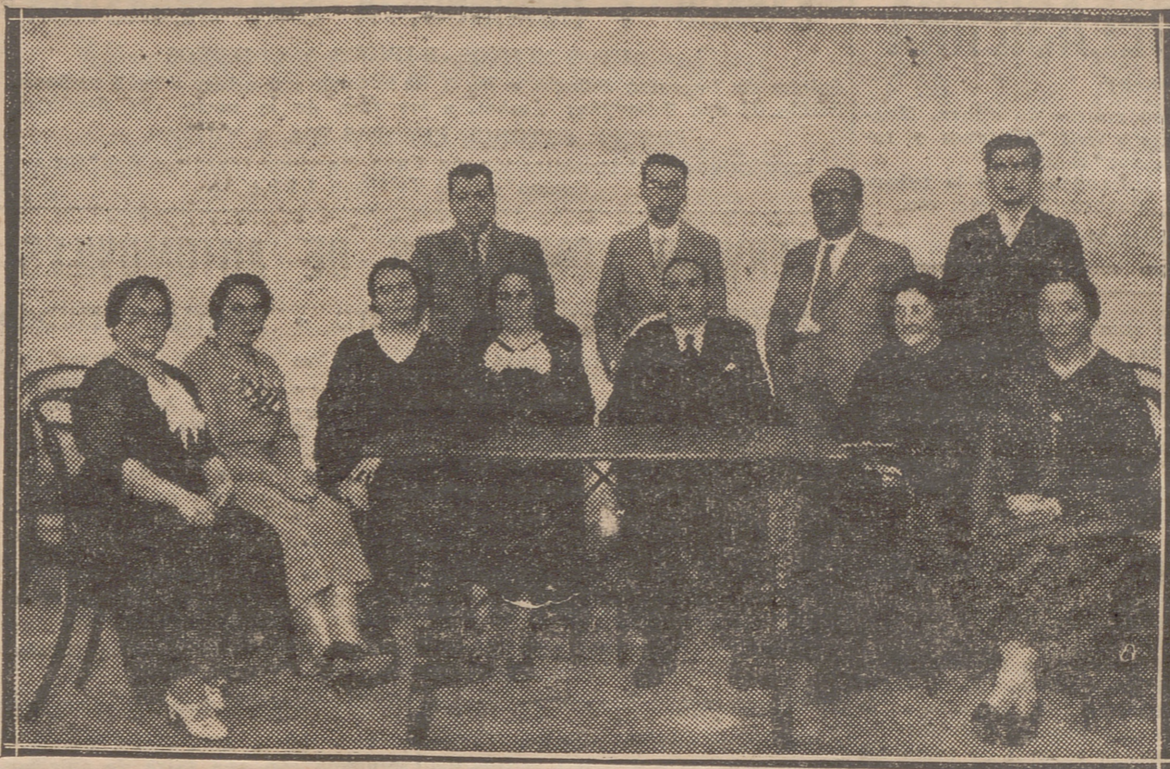
CALAHORRA.—LA JUNTA DE GOBIERNO DE LA "CASA DEL NIÑO", INSTITUCION INAUGURADA EL ULTIMO DOMINGO.

Al anochecer, después de vencer una empinada cuesta, se llega a la capital. Al final de recorrer las cuatrocientas noventa y cinco millas que hay desde Djibouti a Addis Abeba, el tren se ha elevado a unos ocho mil pies sobre el nivel del mar. Hemos sufrido calores desérticos de cien grados Fahrenheit (treinta y siete grados centígrados) y noches invernales. El lamento de las hienas se oye desde los límites de la ciudad.