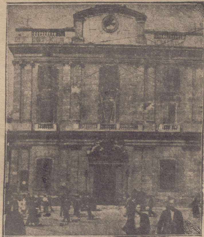
UN ASPECTO DEL LOCAL DE LOS SOMATENES DE BARCELONA, DESPUES DEL BOMBARDEO DE LAS TROPAS