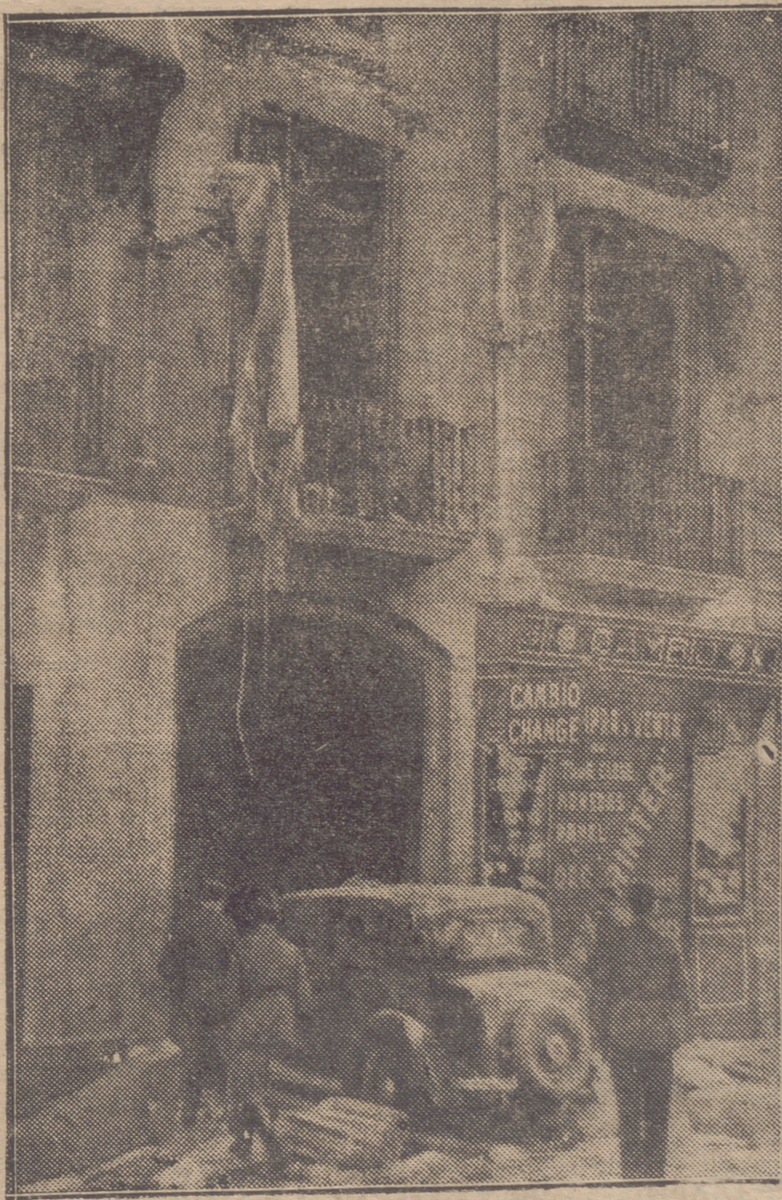
ASPECTO QUE AHORA OFRECE LA FACHADA DEL CENTRO DE DEPENDIENTES DEL COMERCIO Y DE LA INDUSTRIA, DONDE SE HAN ALOJADO LOS DIRECTIVOS DEL ESTAT CATALA DE BARCELONA