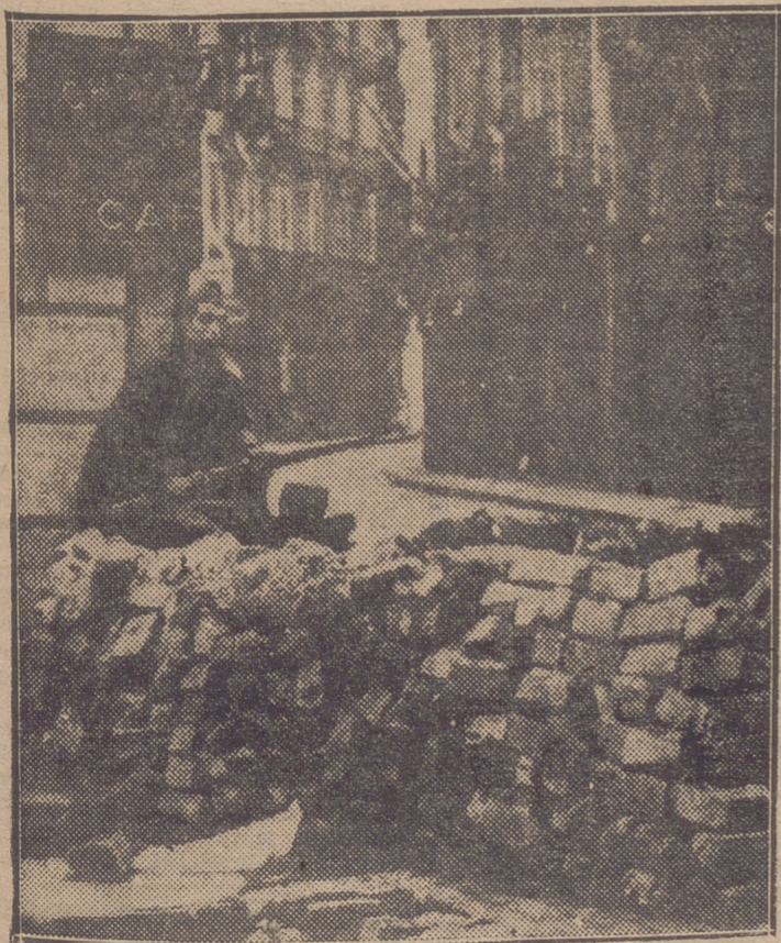
UNA BARRICADA EN LA CALLE DEL PINO DE BARCELONA, ABANDONADA POR LOS REVOLUCIONARIOS