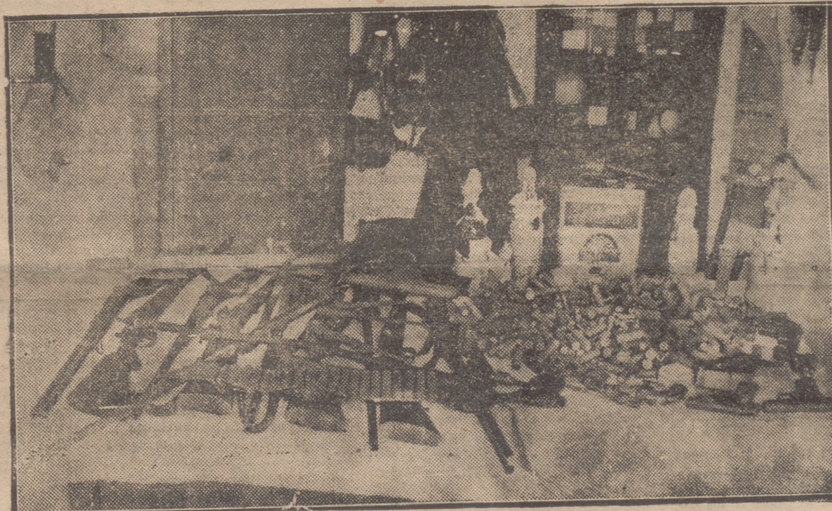
ARMAMENTO ENCONTRADO POR LA GUARDIA CIVIL DE CASALARREINA EN PODER DE LOS REVOLTOSOS, QUE ATACARON EL CUARTEL