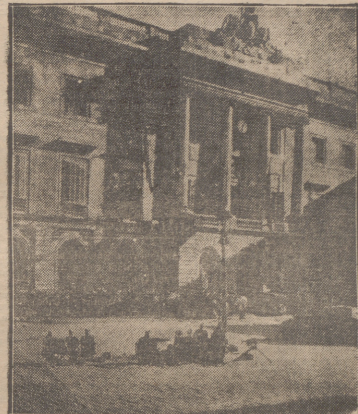
AMETRALLADORAS Y FUERZAS DEL EJERCITO ACAMPADAS EN LA PLAZA DE LA REPUBLICA DE BARCELONA