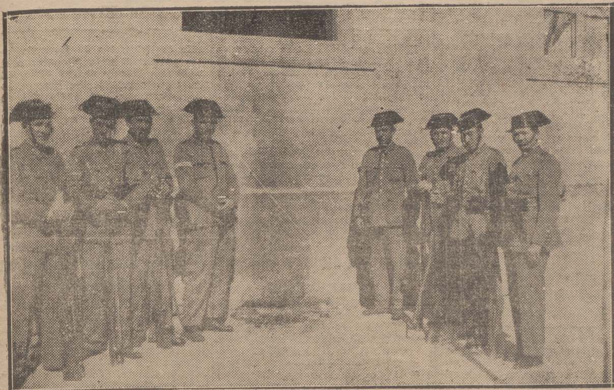
LOS OCHO GUARDIAS CIVILES QUE DEFENDIERON EL CUARTEL DE CASALARREINA, DEBAJO DE LA VENTANA EN QUE VERTIERON LOS REVOLTOSOS LAS BOTELLAS DE LIQUIDO INFLAMABLE.