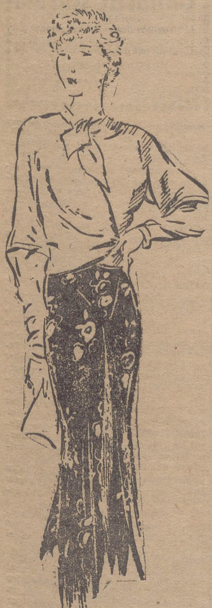
Sobre un vestido impreso negro, azul antiguo y gris, queda muy bien una chaquetita de terciopelo azul.