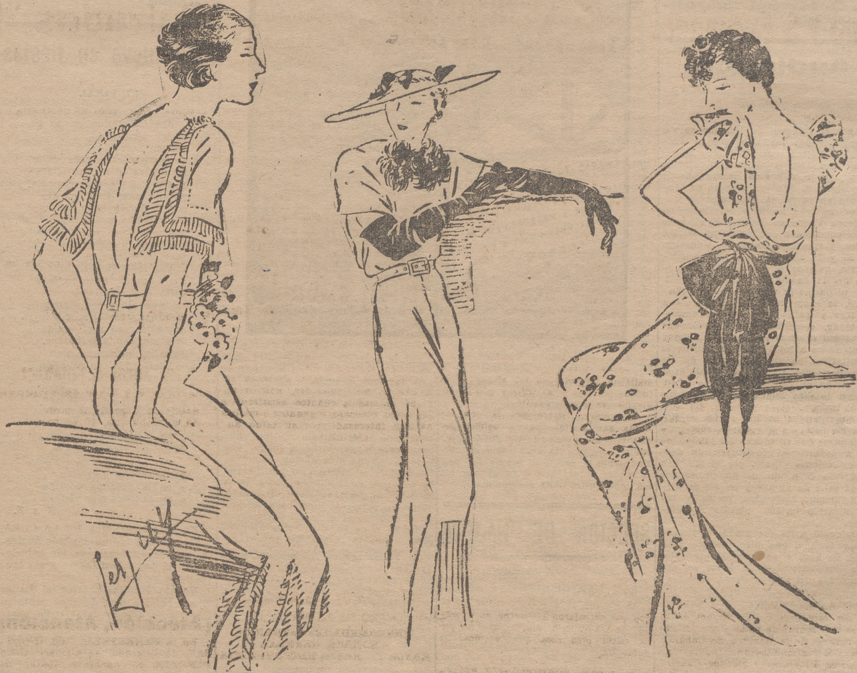
(1) Vestido de noche para el verano, de tela de lino blanca, adornado con dos volantes del mismo género y flores de manzano en la cintura. (2) Vestido de crep blanco, adornado con dos crisantemos azules, dos guantes de crepe azul. El sombrero blanco, adornado con crepe azul. (3) Vestido de noche, de tela blanca impresa con flores, rubies y cintura de terciopelo del mismo tono; adornado con un gran lazo.

ACEITE DE LA FINCA DE SAN RAFAEL (Laserna). — Venta exclusiva. ARAMAYONA. Comestibles. HERRERIAS, 37.