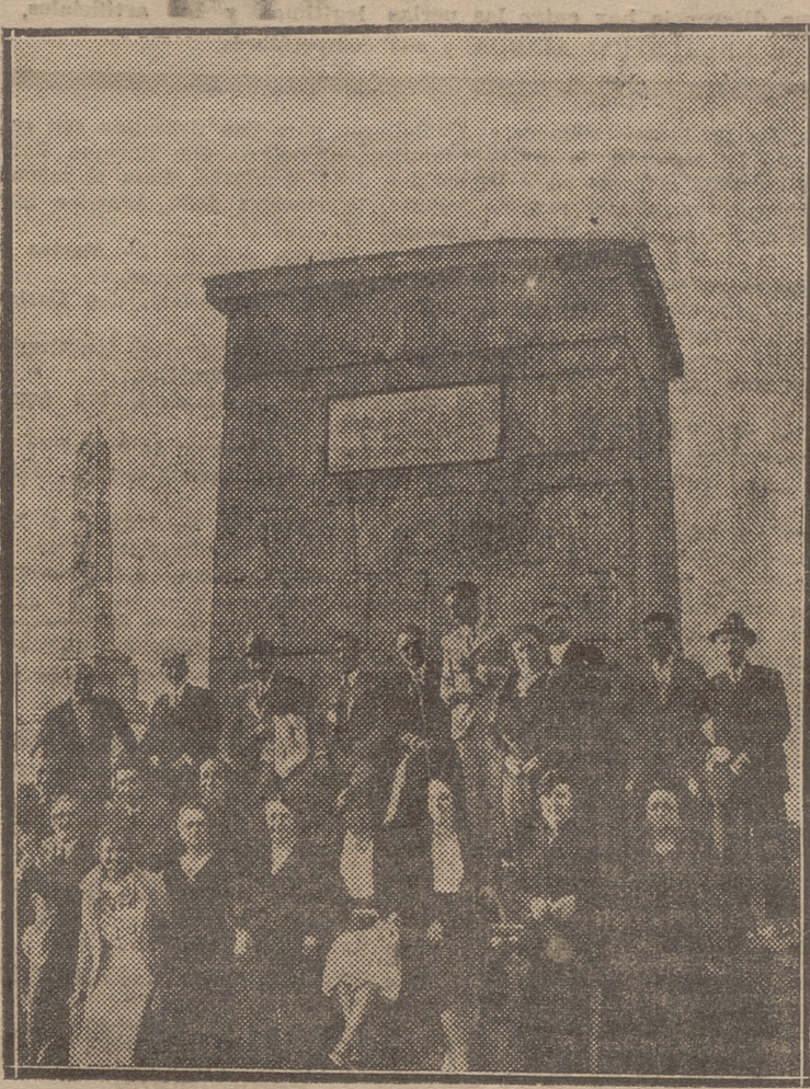
LA EXCURSION DEL ATENEIO RIOJANO. — Grupo de ateneistas en las ruinas de Numancia durante su visita del sábado último.