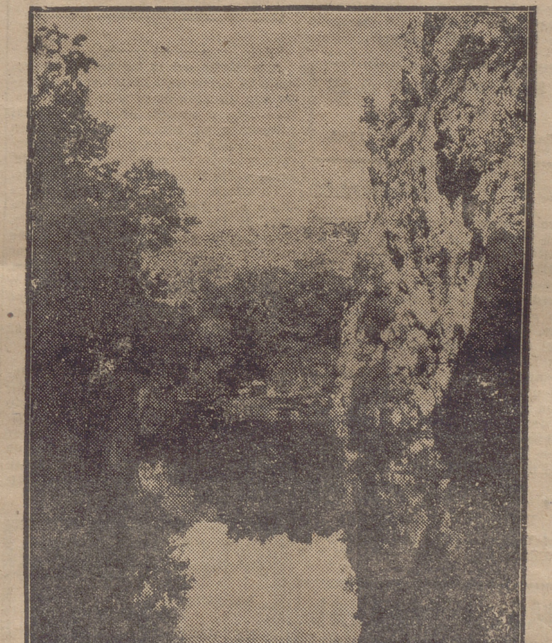
MONASTERIO DE PIEDRA. — El lago del Espejo y la Peña del Diablo. Lugar visitado el domingo por los excursionistas del Ateneo Riojano.

Se considera también definitiva la clasificación final de la carrera, toda