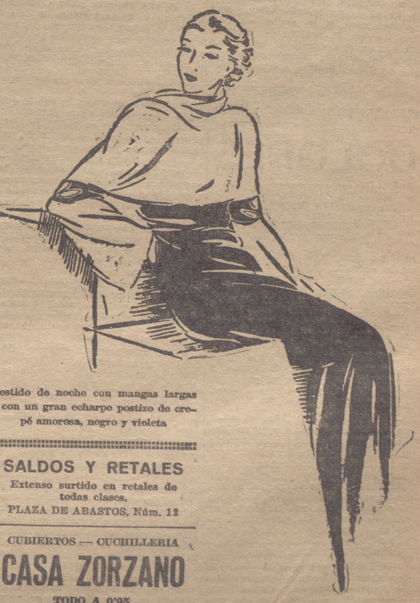
Vestido de noche con mangas largas y con un gran echarpe postizo de crepé amorosa, negro y violeta

COCHES Y SILLAS Gran surtido Precios de fábrica Casa Anguiano