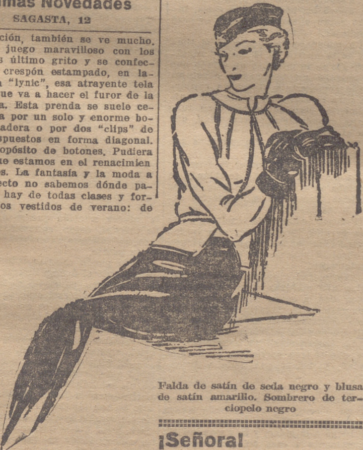
Falda de satén de seda negro y blusa de satén amarillo. Sombrero de terciopelo negro

a la estación, también se ve mucho. Hace un juego maravilloso con los sombreros último grito y se confecciona en crespón estampado, en la nilla o en "lyric", esa atrayente tela de lino, que va a hacer el furor de la temporada. Esta prenda se suele cerrar ahora por un solo y enorme botón de madera o por dos "clips" de metal, dispuestos en forma diagonal. Y a propósito de botones. Pudiera decirse que estamos en el renacimiento de ellos. La fantasía y la moda a este respecto no sabemos dónde parará. Los hay de todas clases y formas en los vestidos de verano: de