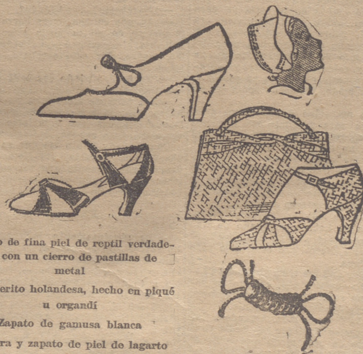
Zapato de fina piel de reptil verdadero, con un cierre de pastillas de metal

Es necesario cuidar mucho las plantas que viven en las habitaciones y saber también que las que se han criado en las estufas son muy sensibles a los cambios bruscos de temperatura. Para conservarlas mucho tiempo en buen estado es necesario sostener, en todo lo posible, una temperatura igual; deben, además, tenerse muy cerca de la luz y no en los cuanones oscuros de las habitaciones. Cuando se abren las