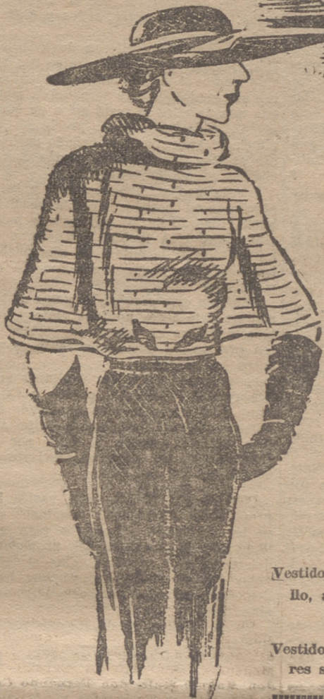
Vestido de seda artificial muy sencillo, adornado con una capita de hermine de verano