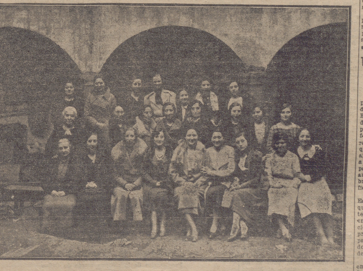
CALAHORRA.—SEÑORITAS ENCAR GADAS DE LAS ESCUELAS NOCTURNAS DEL CIRCULO CATOLICO, A LAS CUALES ACUDEN MAS DE UN CENTENAR DE JOVENES, REUNIDAS PARA SERVIR EL DESAYUNO A SUS DISCIPULAS EN EL CITADO CIRCULO EL PASADO DOMINGO. Fot. Tutor

El auto que tiene matrícula de Haro se encuentra en la carretera.