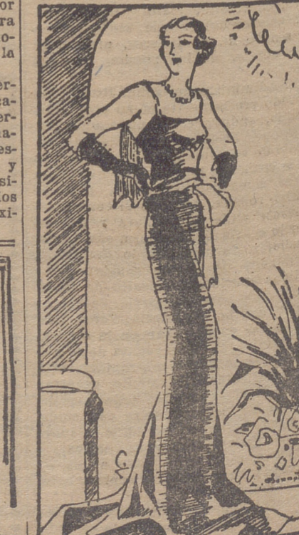
Vestido de noche, de "lamé" plata