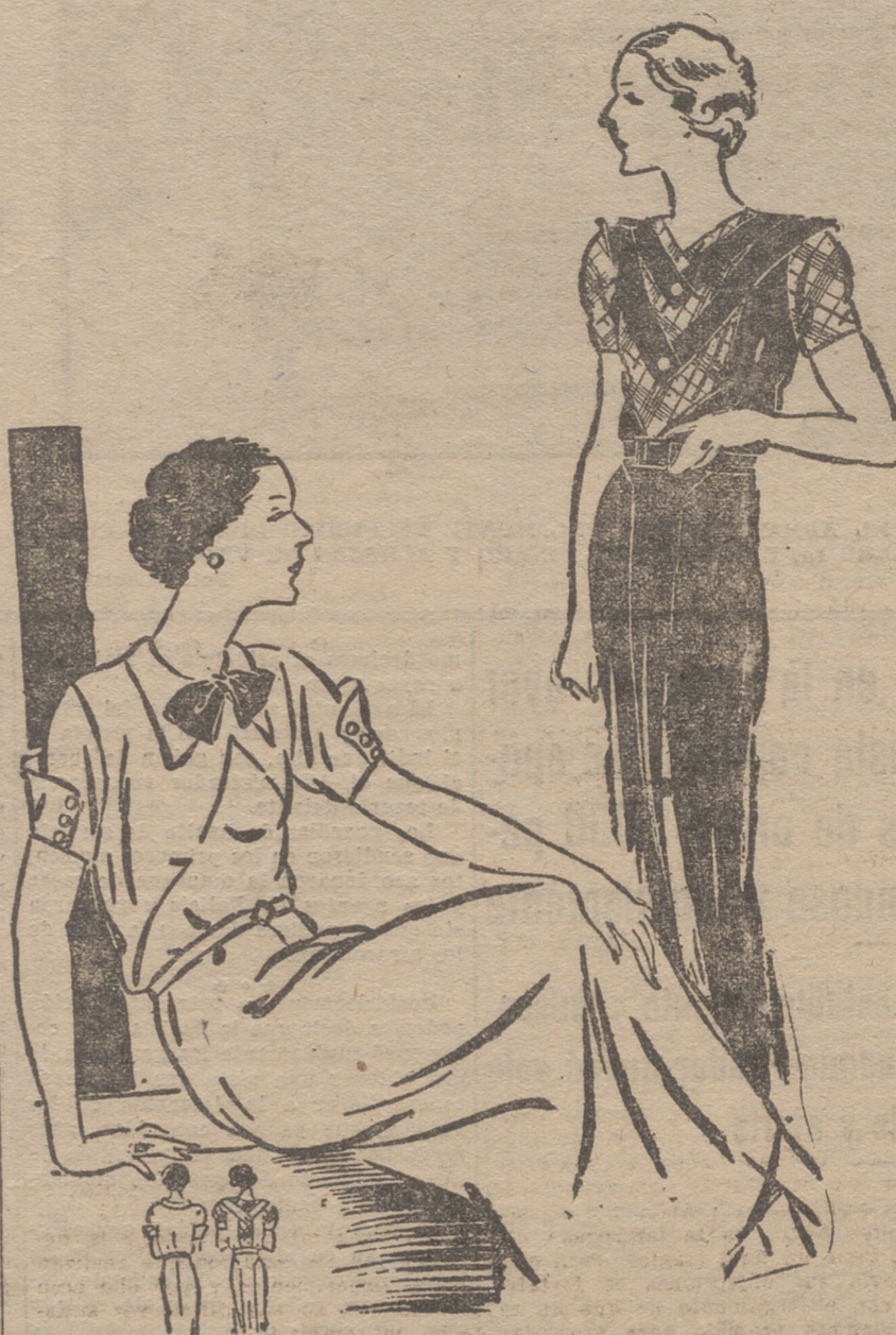
Vestido de crepé de seda natural, color verde mar, adornado con escocés. Vestido de lanita de seda, adornado con cuello y puños de organdi.

actividad elegante, combatiendo sin cesar los amaramientos "demodés" y la fea costumbre de jugarle al nerviosamente con el bolso, el abanico, los guantes o el extremo del chal. No es necesario decir que más feo es aún el mordorio e imperdonable el llevarse las uñas a la boca. No ya en un sentido de higiene y de curioidad, sino porque es una nota de evidente mal gusto que está reñida totalmente con la elegan-