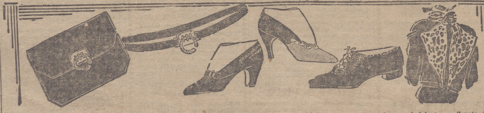
Blusa de satén de seda negra y tela de seda con motas de colores vivos. Zapato bajo de piel de potro, con respuntes en el delantero. Zapato de gamuza castaño y tafilete del mismo color. Zapato de cabritilla clara, adornado con calados. Cinturón de cuero con hebilla de galalita y acero. Cartera de cuero con broche haciendo juego con el cinturón.