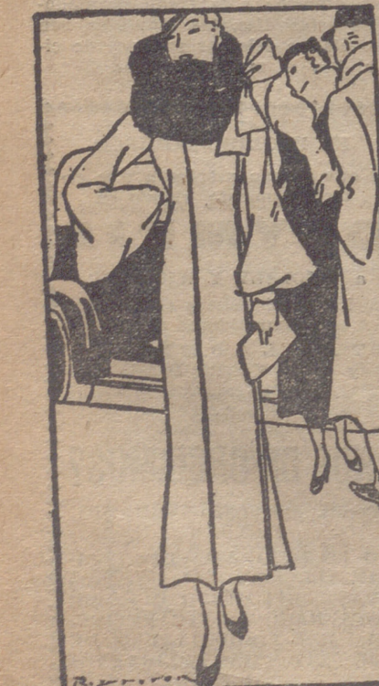
Abrigo de lana azul clara, adornado con piel de zorro gris