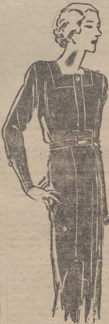
Vestido muy sencillo, de lanita az marino, adornado con recortes.

Seas mujeres que están siempre pendientes de ellas mismas, que confunden lo "bien" con lo cursi y afectado, no son más que absurdas caricaturas de mujeres elegantes, pues carecen de naturalidad para efectuar gestos o mo-