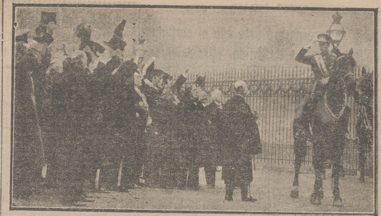
EL NUEVO REY DE BELGICA DESPEDIDO POR LOS PARLAMENTARIOS, DESPUES DE HABER PRES-TADO JURAMENTO ANTE LAS CORTES

MADRID.—Tras de unos días espléndidos, primaverales, cambió el tiempo rápidamente. Desde ayer por la mañana se sintió un frío intenso y granizó algo. Por la tarde cayeron algunos gruesos copos de nieve, que no llegaron a cuajar por ir acompañados de lluvia. LEON.—Una intensísima nevada ha caído en esta provincia, interesando algunas vías de comunicación.