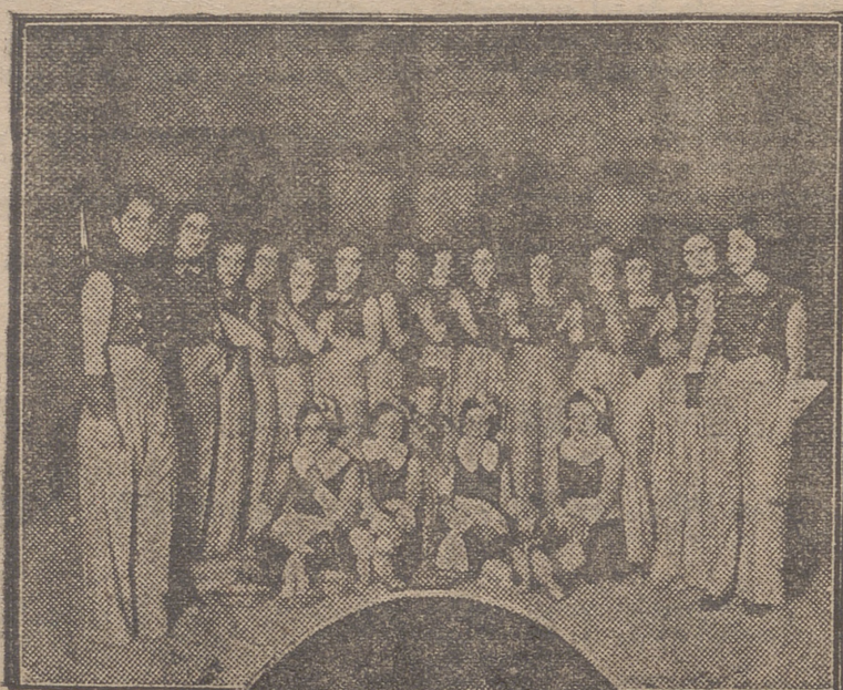
HARO.—Coro de botones, que tomó parte en la función benéfica celebrada el domingo en el Teatro Bretón de los Herreros y las señoritas que postularon por palcos y butacas.

"Danza tortolesca".—Dotrás Vía. En los intermedios discos. Noticias.