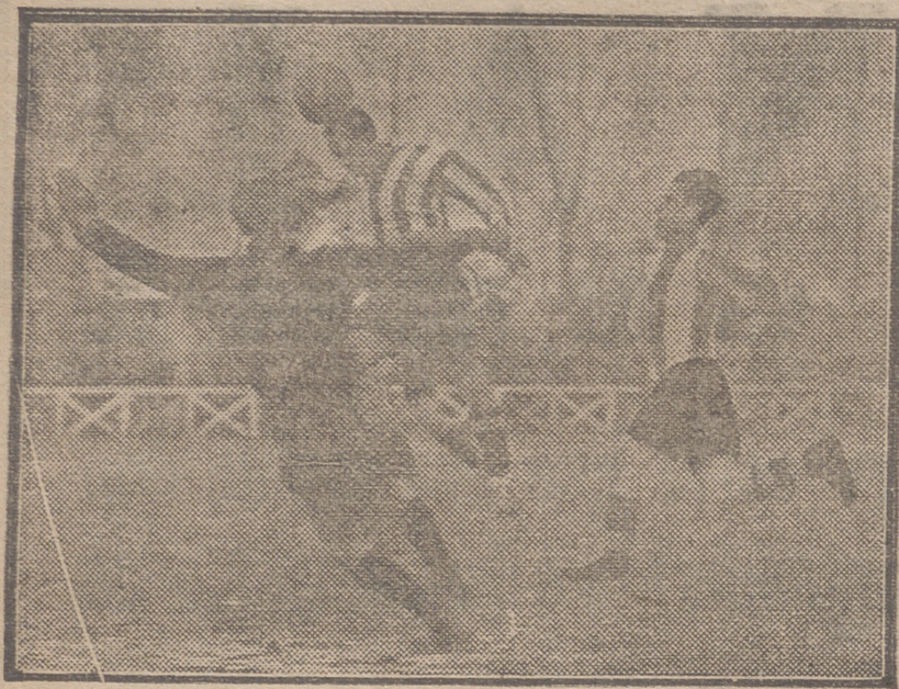
OPORTUNO REMATE DE JULIAC, QUE VALIO AL DEPORTIVO LOGROÑO SU SEGUNDO TANTO.

El anuncio en este periódico es la más eficaz propaganda de los productos y el incremento de las ventas