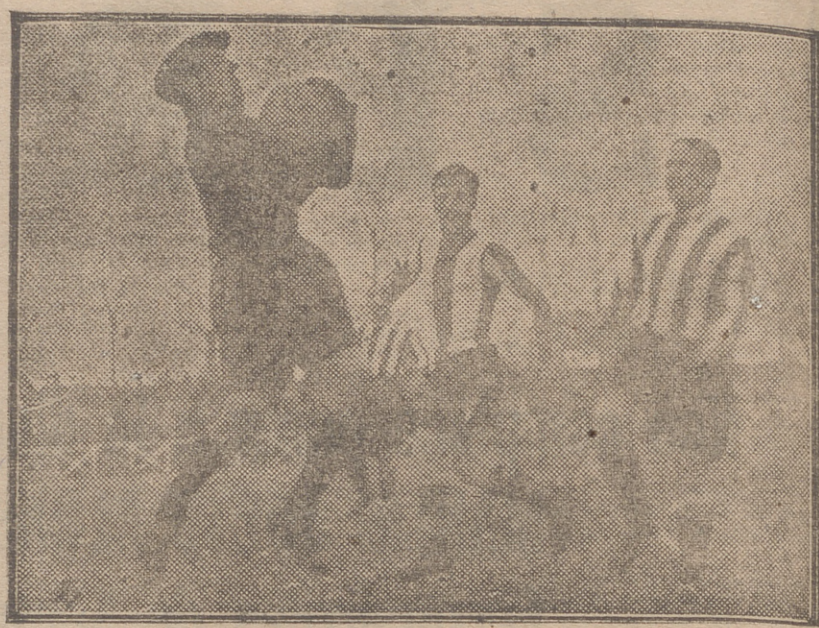
UN BUEN TIRO DE LUISIN Y UN GRAN BLOCAJE DEL PORTERO AVILESINO.