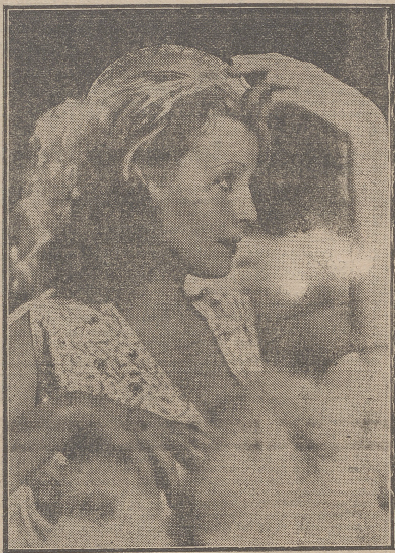
LILLIAN HARVEY, a quien la Fox presenta en "Mis labios engañan" "Mi felicidad".