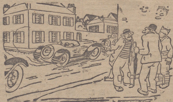
Para ir al hospital, me hace el favor? No tiene usted más que atravesar la calle. (De "Le Journal Amusant", de París.)

fruto excelso de esta inigualada tierra riojana.