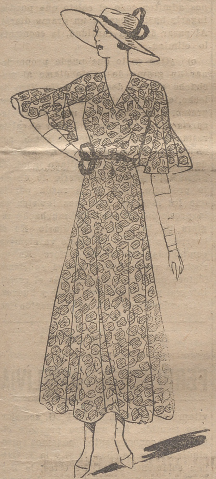
Vestido de organdí impreso con flores azules, beige y blanco. Capelina de organdí blanco, con torzada de terciopelo azul.

PARA FAJAS Y CORSES ECONOMICOS LA SIRENA REPUBLICA, 21