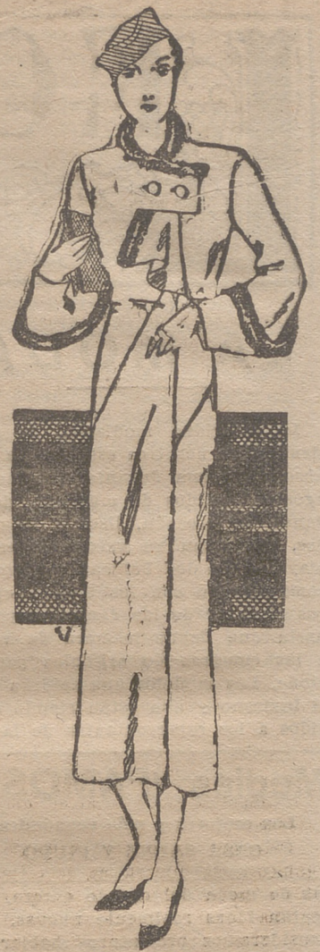
Gabán en crepé de lana crema. Cuello y puños bordados de piel de liebre, negra

a) El cuerpo puede utilizar hasta el último residuo de calcio que absorbe. Se han alimentado ratas de laboratorio con un régimen que contenía suficiente calcio para proporcionarles un desarrollo normal. Una vez muertas, la autopsia demostró que no poseían la perfecta osamenta que se esperaba. Entonces se alimentó a nuevas ratas con un régimen riquísimo en calcio. Su autopsia