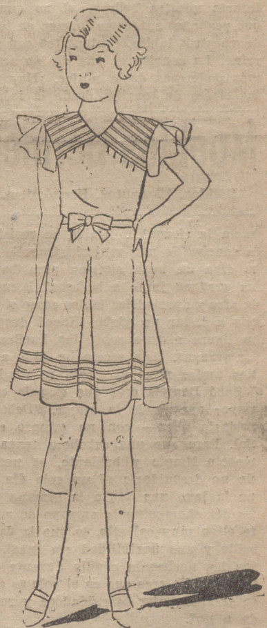
Vestido de organdí rosa, adornado con alforcitas

Las arrugas son el resultado de una tensión interior. Cuando hacéis algún trabajo mental o material procurar que vuestro rostro no se contraiga, sino que guarde una expresión serena y tranquila. Cuántas mujeres tienen la lamentable costumbre de apretar los labios al hacer un esfuerzo cualquiera y después se asombran de los pequeños surcos que afean sus bocas. Dejad, al contrario, caer siempre vuestra mandíbula inferior, tal y como si os pesara y así evitaréis la formación de esas arrugas. Las mujeres cortas de vista suelen