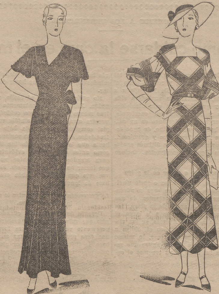
Vestido de comida, de satén violeta, blusa cruzada y anudada al costado. Vestido de foulard escocés marino y blanco

La preacción, en el caso que nos ocupa, no es un punto muy impor-