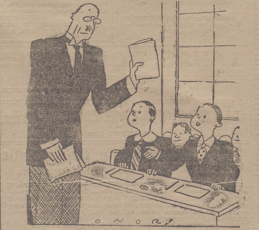
EL PROFESOR.—El tema "Describid un perro" lo habéis desarrollado los dos con las mismas palabras.