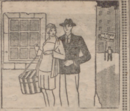
No te acerques al taller ni vuelvas por mi ventana, mientras no logres traer dos butacas para ver