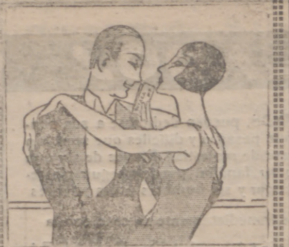
Hoy te quiero más que ayer, pero menos que mañana; y es tan grande mi querer que voy a llevarte a ver