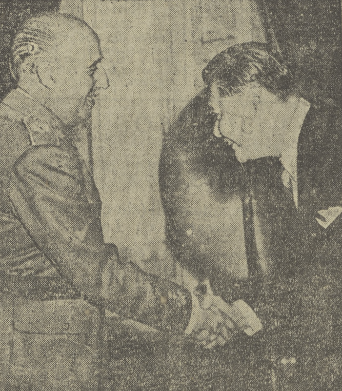
Su Excelencia el Jefe del Estado, Generalísimo Franco, recibe en el Palacio de El Pardo al ministro de Negocios Extranjeros de la China nacionalista, Mr. Yeh.