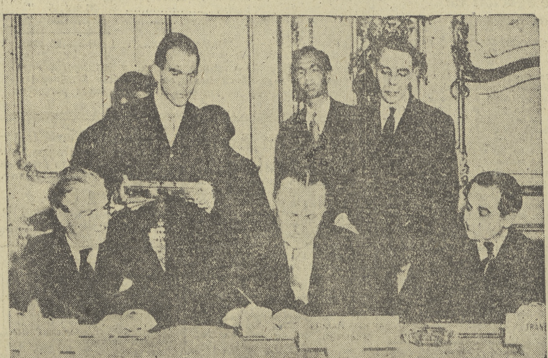
Parce que la reunión celebrada en Londres, a la que asistieron representantes de nueve naciones, ha dado resultados bastante satisfactorios, si bien no está todo resuelto todavía. Pero hubo acuerdo en algo, y ahí, en la fotografía que publicamos, está Adenauer —Eden a su derecha y Mendes-France a su izquierda— firmando el documento correspondiente para la colección de la Historia.