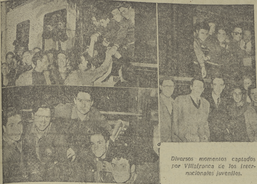
Diversos momentos captados por Villafranca de los internacionales juveniles.

Villafranca fue uno de los numerosos burgaleses que ayer acudieron a la estación de Burgos-Avenida para saludar a los componentes del equipo juvenil español, Campeón del Mundo de Fútbol. Pese a que la parada del rápido en nuestra ciudad no excede de cinco minutos, nuestro cordialísimo saludo a la ciudad y a su primero a los triunfadores españoles y después captar muestras de cariño y, juntamente con jugadores y aficionados burgaleses. Regresan emocionados de su gesta este fotógrafo la satisfacción que les producían estas estas muestras gráficas del contenido de los jugadores juveniles, envían desde nuestras columnas diligente reporter gráfico pudo localiz la afición de Burgos.