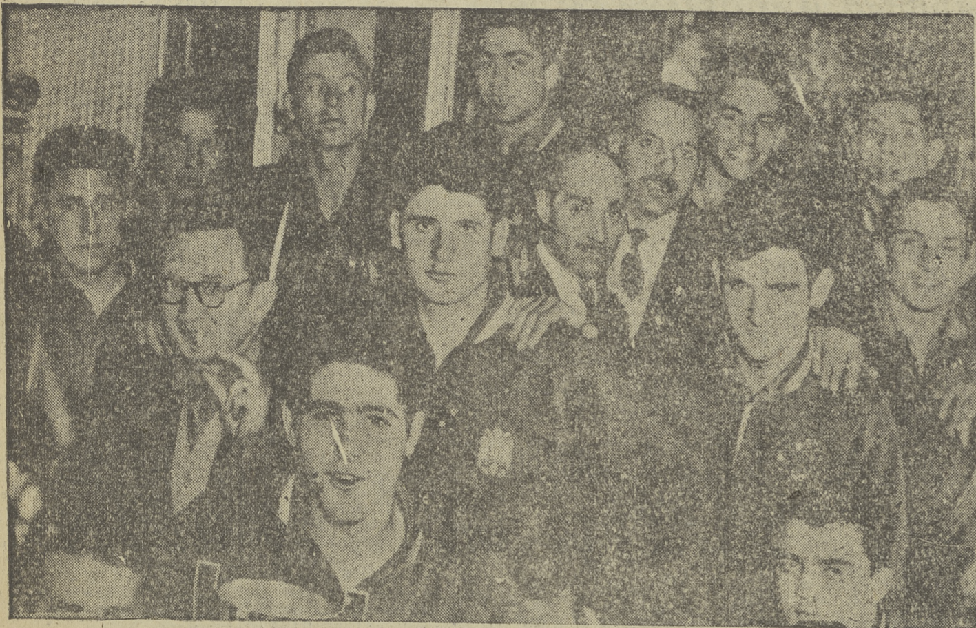
Los jugadores, fotografiados en el tren que les conducía a Madrid.

El entusiasmo ha sido la base de tan magnífico triunfo español