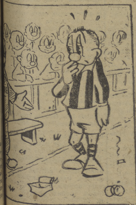
Este despiece largo, pero es que lleva us...