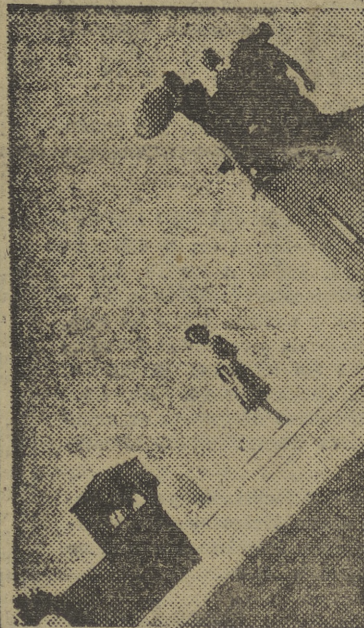
Esta es la torre de San Justo, símbolo de la Italianidad de Trieste y el monumento a los muertos por la independencia de Italia.

Italia no ratificará el tratado de defensa europeo sin que se llegue a una solución equitativa