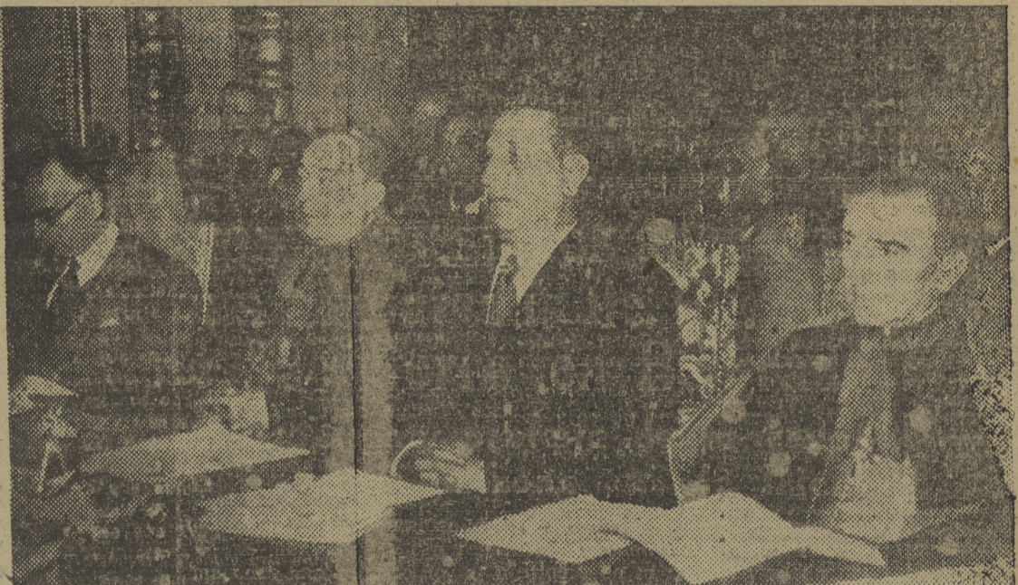
VITORIA. — El ministro de Justicia, señor Iturmendi, acompañado de los obispos de Vitoria y Bilbao, doctores Bueno Monreal y Morcillo, respectivamente, durante la apertura de curso en el Seminario Diocesano