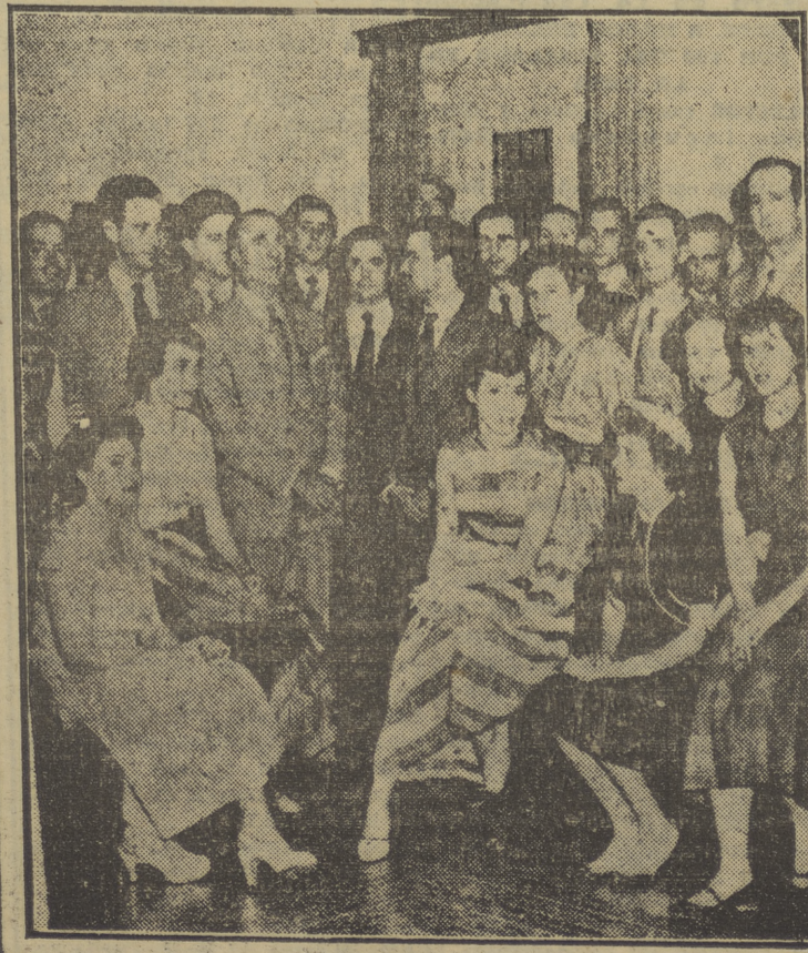
Becarios españoles que marchan a Universidades norteamericanas

En los recientes sucesos ocurridos en la zona soviética de Berlín, los obreros llegaron --como demuestra la "foto"--, incluso, a apedrear los tanques soviéticos. El bravo gesto, que podría parecer inútil en principio, ha servido de aldabonazo en el mundo occidental, tan dado a las concesiones